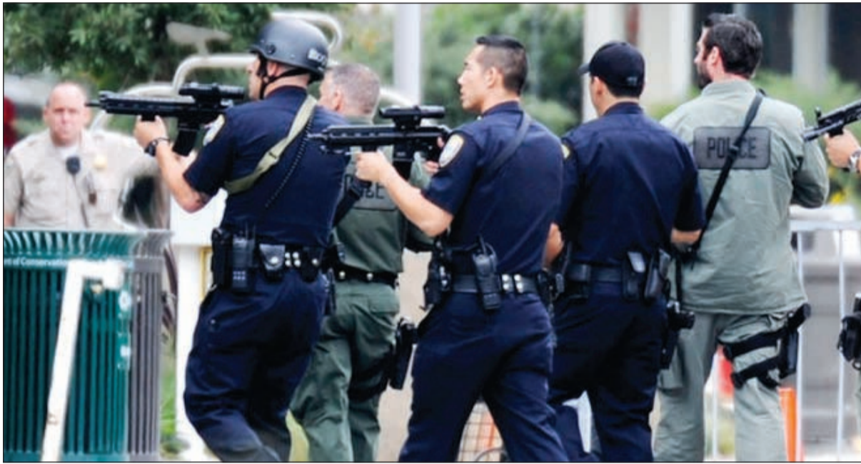
رجال الشرطة يحيطون بمبنى الكلية

الضحايا في منزل محترق قال شهود عيان إن رجلاً تطابق مواصفاته مع مواصفات المسلح أضرم فيه النيران.