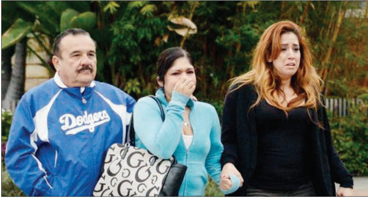
أقرباء أحد الضحايا

يشار إلى أن الباحثين بذلوا قصار جهدهم في استخراج الحمض النووي القديم من حفرة «نياندرال»، وذلك باستخدام الأشعة السينية وعملية المسح المقطعي، لكن باءت بالفشل.