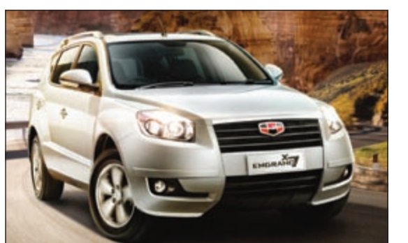
قوة وفخامة عالية في سيارات جيلي