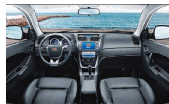
مقصورة داخلية غاية في الروعة

قامت الشركة الكويتية لاستيراد السيارات (الشايح والصقر)، الموزع المعتمد لسيارات جيلي في الكويت، بكشف الستار عن سيارتها العائلية الجديدة «جيلي إيمجراند X7»، الموديل الأحدث والذي طال انتظاره في مجموعة سيارات جيلي في الكويت، وبعد عام على الإطلاق الناجح لعلامة جيلي في الكويت، أصبح جيلي في الكويت، أصبح بالامكان رؤية سيارات جيلي تغزو شوارع الكويت ب أربعة موديلات E7, E8- LC Panda, GX2 - والتي تعمل بكفاءة منذ انطلاقتها في الكويت العام الماضي. ويهذه المناسبة قال المدير العام في كايكو اشيش تاندورن: «إنها المرة الأولى التي تطرح فيها جيلي إيمجراند سيارة SUV في السوق الكويتي، لذلك هناك الكثير من الأثارة لدى محبي هذه العلامة التجارية الصينية الرائدة، نحن على ثقة بأن جيلي إيمجراند X7 سيكون لها تأثير كبير على سوق سيارات الدفع الرباعي في الكويت، جيلي إيمجراند X7 هي القيمة الحقيقية للمال، مشيراً إلى أن هذا النموذج يحمل ناقل حركة أوتوماتيكية DSi 6AT ذات مستوى عالمي ومحرك CVT 2,4L والذي أصبح علامة مميزة من سلسلة Emgrand X7. تظهر جيلي إيمجراند X7 بطريقة ديناميكية مع الرحابة الداخلية المميزة والتصميم متعدد الوظائف. ان محرك 6AT في جيلي إيمجراند X7 تم تصنيعه من قبل DSi العالمية للمركبات ثاني أكبر شركة في العالم لإنتاج ناقلات الحركة مع تكنولوجيا التصنيع الرائدة، لتوفير أقصى درجات الراحة والتحكم ونقل الحركة DSi تستخدم تحكم كلتشر مستقل، حلقة مغلقة من