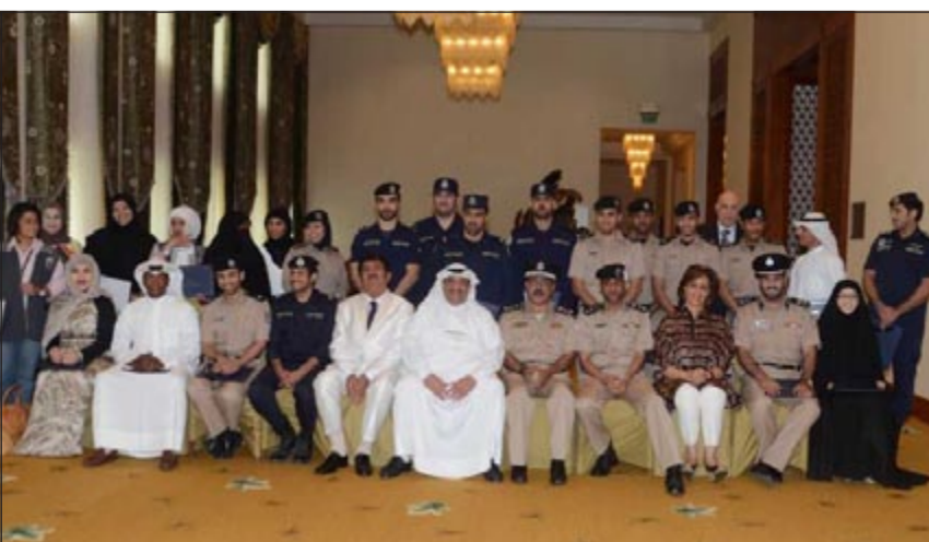
صورة جماعية للمشاركين في الدورة مع العميد السعدون