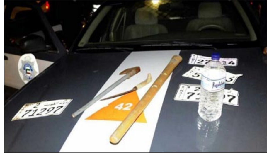
خمور وأسلحة بيضاء تم ضبطها خلال الحملة