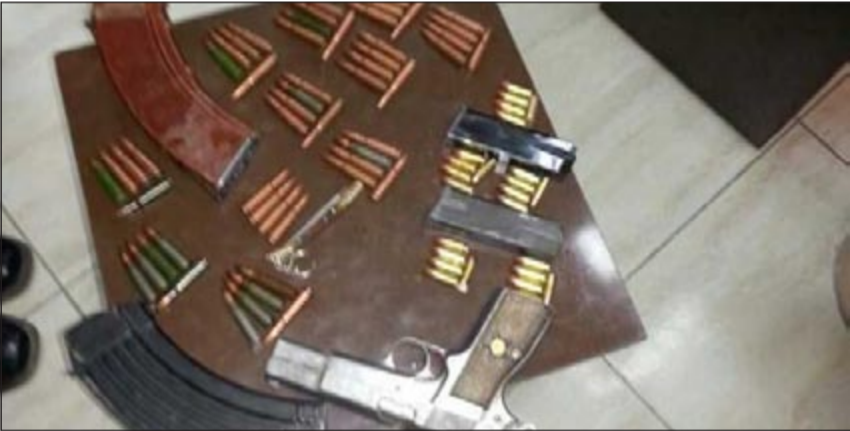
كمية الاسلحة التي ضبطت مع الشاب البدون