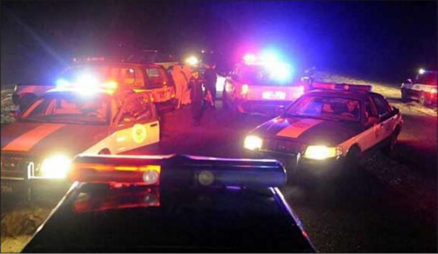
دوريات الأمن تغلق طريق الأرتال أمس الأول