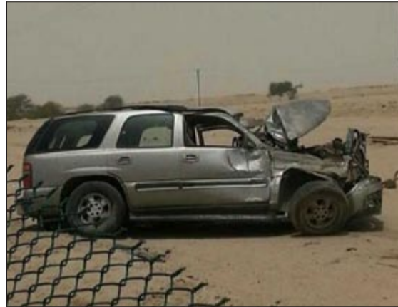
سيارة الشاب البدون بعد حادث الانقلاب

الخالدي عن وجود كمية من الاسلحة داخل المركبة ليتم حصرها والتحفظ عليها، وأشار المصدر إلى أن الاسلحة المضبوطة تتمثل بكلاشنكوف ومسدس نوع 9 ملي وعدد 54 طلقة كلاشنكوف و25 طلقة مسدس، وأضاف المصدر بأن رجال المباحث بانتظار تحسن حالة الشاب الذي ادخل عناية الفروانية