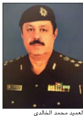
العميد محمد الخالدي

أسف شباب من فئة البدون إلى مستشفى الفروانية مساء أمس الأول بعد انقلاب سيارته على طريق الدائري السادس السريع وتم العثور على كميات كبيرة من الذخيرة والأسلحة بسيارة المصاب الذي سجل بحقه قضية في مخفر الصليبية حملت مسمى حيازة سلاح وانقلاب.