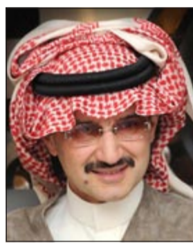
الامير الوليد بن طلال

رفع الأمير الوليد بن طلال رئيس شركة المملكة القابضة، دعوى تشهير ضد مجلة «فوربس» الأميركية، متهمًا إياها بتعمد إساءة تقدير ثروته، حسبما نقلت صحيفة «الغارديان» البريطانية. وكانت شركة المملكة القابضة قطعت تعاونها مع مجلة «فوربس» الشهيرة بعد أن قدرت الأخيرة ثروة الأمير بـ 20 مليار دولار فقط ووضعت في المرتبة السادسة