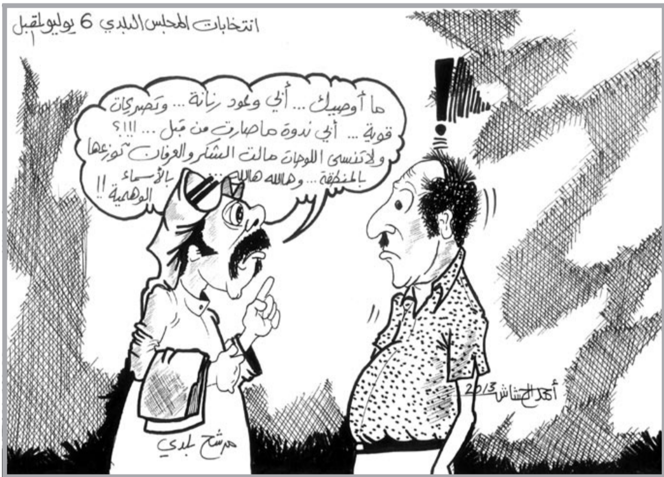
انتخابات المجلس البلدي 6 يوليو لقبيل

لمجلس الوزراء فلعل هذا يكشف سبب تخبط كل القرارات الحكومية ووقوعها في الاخطاء تلو الاخطاء، وما اقول إلا «سفوا.. هيتكم». الدراسة رغم هذا الخطأ الكارثي من التناقض في انها وجهت النقد الحاد لشيء لم يكن ليستوجب النقد، دون ايجاد حلول الا انها كشفت حقائق كارثية، مثلا ان عدد الكويتيين العاملين في الصيد والزراعة 96 فقط مقابل 26185 غير كويتي في هذين المجالين الآخرين. أما الأمر الغريب الذي كشفته الدراسة من واقع الهذات وزارة الشؤون فهو أن 41٪ من الموظفين الكويتيين هم من «الكتبة» اي موظفي الخدمات الحكومية، وكأننا في بلد يديره الكتبة. اما الاخطر فإنه في العام 1995 كان يوجد 2489 عاطلا عن العمل واليوم وكما نعلم ان العاطلين عن العمل في الكويت أكثر من 15 ألف عاطل، هل تفهمون ماذا يعني ان لدينا أكثر من 15 ألف عاطل؟!