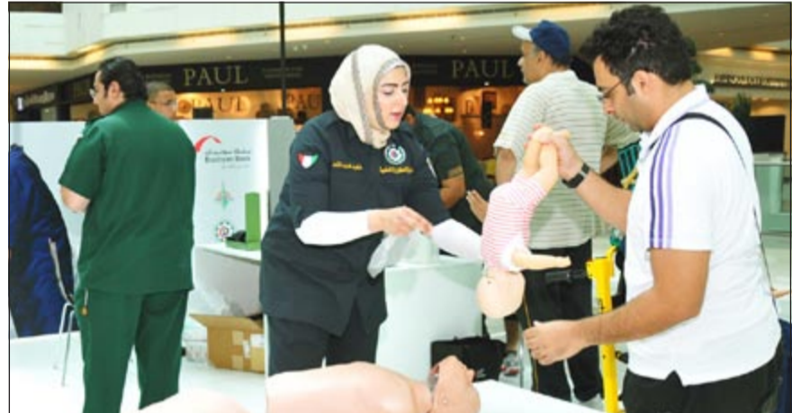
إحدى المسعفات تشرح لأحد الشباب مبادئ الإسعافات الأولية (محمد خلوصي)

غصّة البالغ، بدوره، قال مدير تحقير الآخرين على الانضمام إلى الإدارة بأعداد أكثر. من جانبها، قالت رئيس قسم العلوم الطبية التطبيقية بكلية العلوم الصحية بالهيئة العامة للتعليم التطبيقي والتدريب ورئيسة الحملة «هناك المبدأ: ان الهدف من الحملة هو توعية وتنقيف الناس بكيفية التعامل في حالة حدوث إصابة في البيت أو المدرسة أو الشارع أو المجمع أو مجال العمل أو غيره، والتي يمكن أحياناً انقاذها من الشخص يعرف الطريقة الصحيحة في التعامل معها فقد يضر المصاب. وأضاف الماجد ان هناك اقبالاً شديداً من قبل رواد المجمع، وقد تم تقديم عدة فحوصات للمجموع منها فحص ضغط الدم، السكر، وضافة الى التدريب على إنعاش القلب الرئوي في حالة فقدان الوعي وتوقف التنفس، والتعامل مع الغصّة عند الأطفال التي تختلف عن