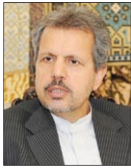
روح الله قهرماني

وذكر انه في المجال الفقهي حرص الإمام الفقيه على تطوير وعصريته العلوم الفقهية باعتباره مرجعاً واعياً ومدركاً لمتطلبات الزمن ومستجداته حيث أصدر العديد من الفتاوى الجديدة التي تتسجم مع متطلبات العصر. وعن دور المرأة ذكر قهرماني ان الإمام الخميني لم يغفل دورها ومكانتها بل كان يكن لها كل التقدير وينسجها على ممارسة دورها التوعوي من خلال المشاركة الفاعلة في المظاهرات والمسيرات الشعبية العارمة ضد النظام الملكي المقيور، كما اهتم بمشاركتها في كل النواحي السياسية والبرلمانية والاجتماعية والثقافية بعد انتصار الثورة المجيدة. وتطرق قهرماني الى القضية الفلسطينية، مشيراً الى انها كانت «الشغل الشاغل الذي احتل حيزاً كبيراً من اهتمامات الإمام الخميني فقد دعى الى دعم المقاومة الفلسطينية منذ انطلاق