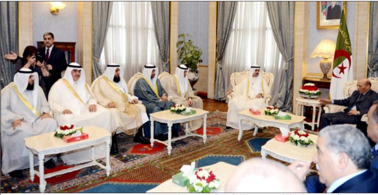
رئيس مجلس الأمة علي الراشد والوفد المرافق مع رئيس مجلس الشعب الجزائري محمد العربي