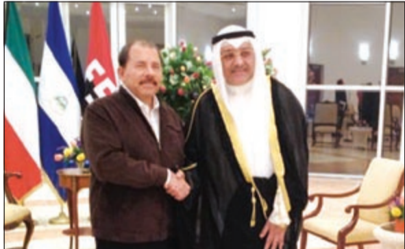
السفير سميح جوهري حيات أثناء تقديم أوراق اعتماده إلى رئيس نيكاراغوا

كما أشادت الوزيرة دشتي في كلمتها بالجهد الذي بذل في تطوير وإعادة تأهيل مقر المعهد في دولة الكويت والتأثير الإيجابي للتطوير والتحديث الكبير الذي لحق به على متدربي المعهد الذين يشاركون في دوراته التدريبية