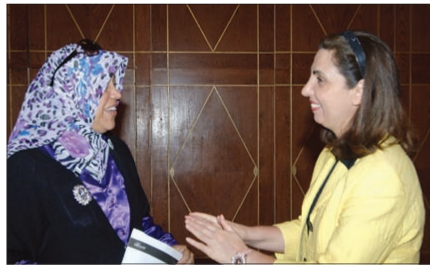
د.رولا دشتي متحدة للزميلة هناء السيد

كما أشادت الوزيرة دشتي في كلمتها بالجهد الذي بذل في تطوير وإعادة تأهيل مقر المعهد في دولة الكويت والتأثير الإيجابي للتطوير والتحديث الكبير الذي لحق به على متدربي المعهد الذين يشاركون في دوراته التدريبية