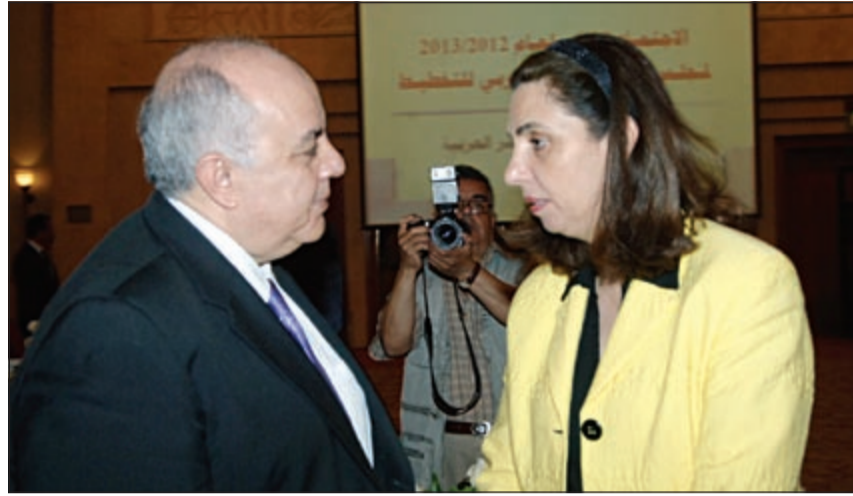
الوزيرة رولا دشتي والوزير المصري عمرو دراج