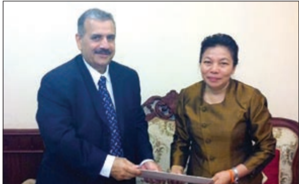
السفير محمد الرومي خلال لقائه نائبة وزير خارجية جمهورية لاوس سونثون ساياشك

وذكرت سفارتنا في لاوس في بيان تلقتة «كوونا» أن الرومي نقل خلال اللقاء تحيات صاحب السمو الأمير الشيخ صباح الأحمد وسمو ولي العهد الشيخ نواف الأحمد إلى رئيس جمهورية لاوس الديموقراطية الشعبية شومالي ساياسون. كما سلم الرومي إلى ساياشك رسالة خطية من نائب رئيس مجلس الوزراء ووزير الخارجية الشيخ صباح الخالد موجهة إلى