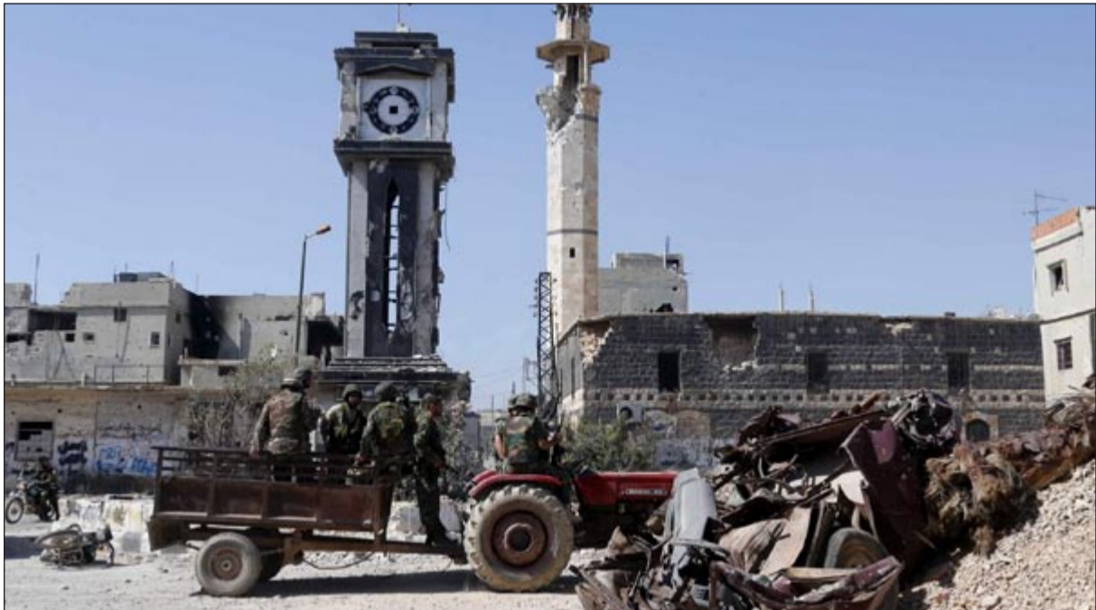
قوات النظام السوري في ساحة الساعة بمدينة القصير أمس

عندما يستمررون في القيام بذلك والسلطات اللبنانية لا تتخذ أي إجراء لمنعهم من التقدم إلى سورية، اعتقد بأن ذلك سيسمح لنا بمحاربتهم داخل الأراضي اللبنانية. وكانت وكالات أعلام نقلت بيانات لنشطاء المعارضة السورية قالوا فيها إن مقاتلي المعارضة انسحبوا ليلًا من بلدة القصير في الريف الجنوبي لحمص بعد مذبحة ارتكبتها الجيش السوري ومقاتلو حزب الله اللبناني أسفرت عن مقتل المئات. وقال أحد مقاتلي حزب الله لرويترز «قمنا بهجوم مفاجئ في الساعات الأولى من الصباح ودخلنا البلدة ولأدوا للمدنيين والجرحى والكل همه وأميتش أنه يلحق بركب من