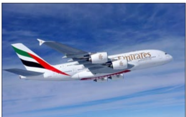
طائرة طيران الإمارات الإيرباص A380 ستبدأ خدمة زيورخ اعتبارا من 1 يناير 2014

ومنذ بدء انضمام هذه الطائرات لأسطول الناقل في 2008، سافر على رحلات A380 أكثر من 17 مليون راكب.