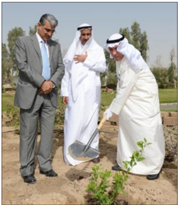
جانب من الاحتفال بيوم البيئة العالمي

نسبة المساحات الخضراء على درجات الحرارة، وزيادة نسبة الأكسجين.