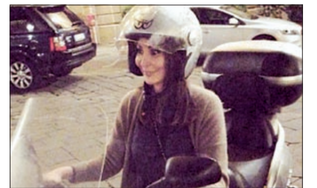
إليسا ودراجتها في شوارع إيطاليا

تتابع الفنانة إليسا رحلتها السياحية ضمن فترة النقاهة التي بدأتها منذ أيام قليلة، ولم تنس إليسا أن تبقى جمهورها على اتصال دائم بها من خلال الصور المميزة التي تنشرها يومياً وكان آخرها صورة وهي تستقل الدراجة النارية في إيطاليا وصور أخرى مع أصدقائها ومن أماكن مميزة في إيطاليا تظهر فيها بإطلالات مميزة ضمن مناظر خلابة.