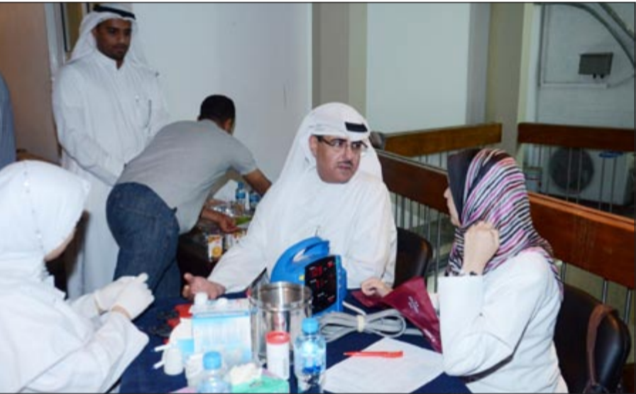
جانب من حملة التبرع بالدم

مثل هذا اليوم للتبرع بالدم يعتبر من الأنشطة الإنسانية والوطنية والتي تحرص النقابة على ترسيخها في المجتمع، مشيراً إلى أن تدفق العاملين في وزارة الإعلام من قياديين وموظفين للتبرع بالدم يؤكد حرص المجتمع الكويتي على المشاركة الفعالة والبناءة في خدمة وطنه ومجتمعه.