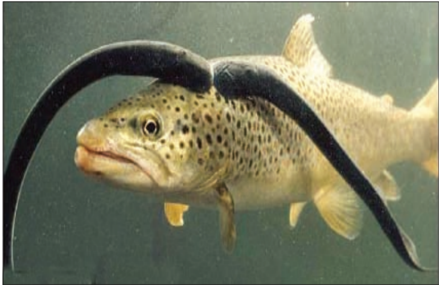
السكة مصاصة الدماء

ميتشغان - وكالات: أطلقت مجموعة بيئية حملة لمكافحة أنواع من الأسماك الدخيلة على بحيرة «ميتشغان» الأميركية، التي وصفتها بـ «مصاصي الدماء». وتعيش تلك الأسماك، التي يطلق عليها «أنقليس الجحر الكبير»، على قتل كل الكائنات الحية التي تعيش حولها من أسماك وغيرها، وتمتص كل السوائل الموجودة في أجسادها.