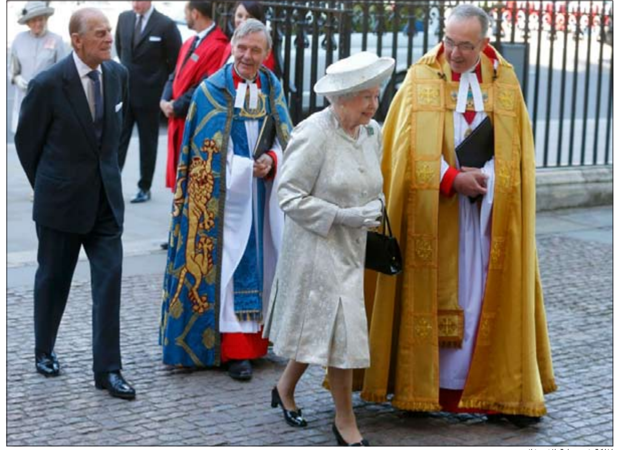
الملكة في بداية الاحتفال

طلقات مدفعية وقداس في كنيسة وستمينستر واحتفال شعبي كبير