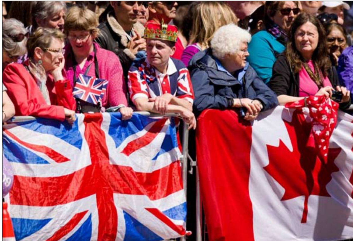
فرحة شعبية كبيرة بالذكرى الـ 60 لتتويج الملكة

احتفلت بريطانيا أمس بالذكرى الستين لجلوس الملكة إليزابيث الثانية على عرش البلاد وأقيم قداس في كنيسة وستمينستر عرض خلاله تاج لا يقدر بثمن لم يخرج من برج لندن منذ 60 عاماً وتوج به كل ملوك بريطانيا على مدى 350 عاماً. كان هذا التاج المصنوع من الذهب والمطعم بالياقوت الأحمر والأزرق وحجر