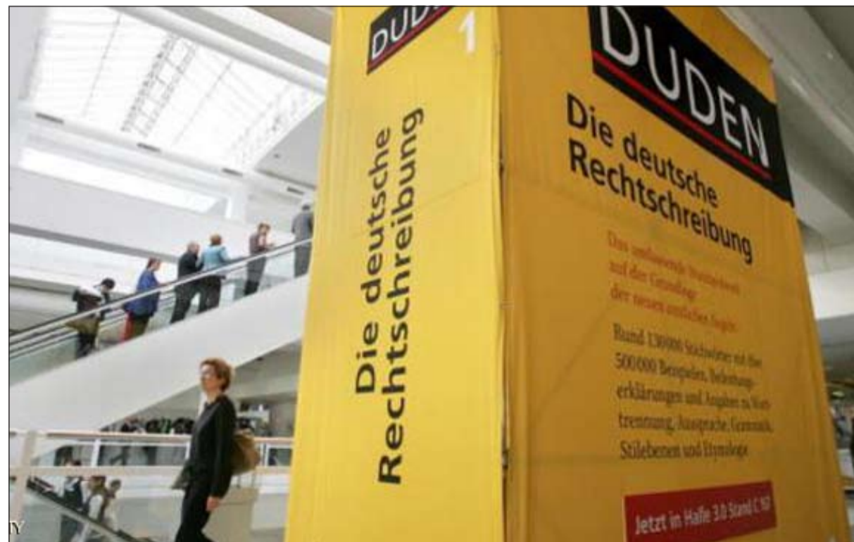
قاموس اللغة الألمانية

أطول كلمة مسجلة في موسوعة غينيس للأرقام القياسية يعود إلى كلمة مؤلفة من 39 حرفاً وتعني «شركات التأمين التي توفر الحماية القانونية». وجاء قرار المحكمة الواقعة في ولاية ميكلنبورغ فوربومرن الأسبوع الماضي بإلغاء استخدام الكلمة التي يبلغ عدد حروفها 63 حرفاً في قانون الولاية. من جانبه قال الباحث اللغوي البروفيسور أناتول شتيفانوفيتش لوكالة الأنباء الألمانية (د.ب.أ) إن الكلمة