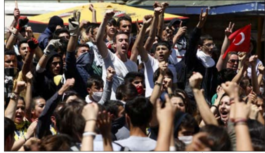
جانب من الاحتجاجات في انقره امس

عواصم - وكالات: شهد اختبار القسوة الجاري منذ خمسة أيام بين رئيس الوزراء التركي رجب طيب أردوغان وعشرات آلاف المتظاهرين الإترك الذين يتحدون سلطته في الشارع، تطوراً جديداً مع إعلان اتحاد نقابات القطاع العام إضراباً امس بعد مقتل متظاهر ثان. ويعد ليلة جديدة من التعبئة وأعمال العنف في عدد من مدن البلاد، قرر اتحاد نقابات القطاع العام، احد اكبر الاتحادات النقابية في البلاد، دعم الحركة الاحتجاجية بتنفيذ اضراب ليومين اعتباراً من امس. وعلن الاتحاد اليساري التوجه والذي يعد 240 ألف منتسب أن «الإرهاب الذي تمارسه الدولة على تظاهرات سلمية تماماً يتواصل بشكل يهدد حياة المدنيين». ويعد مقتل شباب الاحد الماضي دهسا بالسيارة خلال تظاهرة في إسطنبول، قتل متظاهر ثان عمسه 22 عاماً مساء اول من امس خلال تجمع في محافظة هاتاي بإطلاق نار مجهول المصدر، على ما أعلن حاكم المدينة جلال الدين لاکزیز. وفتحت الشرطة تحقيقاً في ظروف الوفاة التي لا تزال غامضة. وفي غياب رئيس الوزراء رجب طيب أردوغان الذي يقوم بزيارة رسمية لدول المغرب العربي تستمر حتى يوم غد، التقى الرئيس عبدالله غول نائب رئيس الوزراء بولند ارينج في نطاق لقاءاته مع