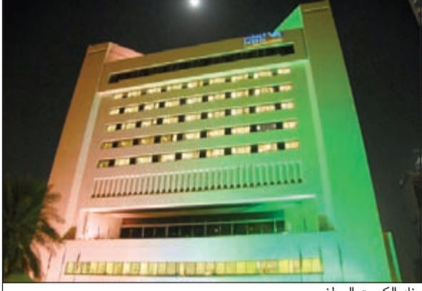
بنك الكويت الوطني

آخر أخبار الاقتصاد المحلية والعالمية زوروا موقعنا على www.alanba.com.kw/Business