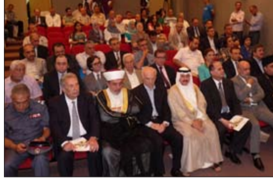
السفير عبد العال القناعي متقماً الحضور خلال الاحتفال