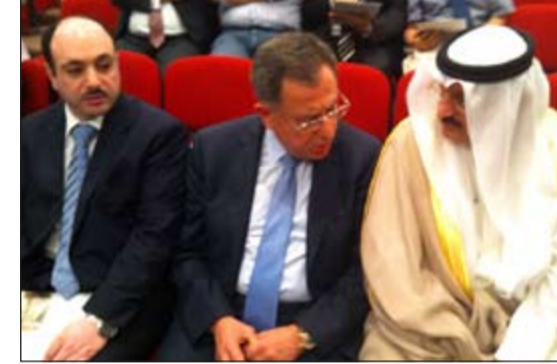
عبدالعال القناعي مع الرئيس فؤاد السنيرة و م. نواف الديوس

من القادة العرب لتمويل مثل هذه المشروعات، فقد استجاب صاحب السمو الأمير الشيخ صباح الأحمد للمساعي التي بذلتها وأكمل عقد الممرات العربية في الموافقة على المشاركة في تمويل إنشاء متحف مدينة صيدا وذلك بجهة كريمة بمبلغ 4 ملايين دولار ويتولى تنفيذها كما نرى الصندوق الكويتي ويشارك في جزء من التمويل المطلوب العربي الذي يرأسه عبداللطيف الحمد بمبلغ 850 ألف دولار. وأضاف السنيرة: «لقد اتبع صاحب السمو الأمير مكرماته بالاستجابة إلى المساعي التي بذلتها أيضاً مع سموه، وذلك بالموافقة على تمويل إنشاء المتحف التاريخي لمدينة بيروت بجهة كريمة بمبلغ ثلاثين مليون دولار، والعمل بتقديم على مسار البدء بتنفيذ هذا المشروع الأخير». وتابع: «إن أهمية هذه الخطوة اليوم تكمن في أنها تطلق عجلة العمل في إنشاء ثاني متحف وطني للأثار والتاريخ والتراث في لبنان بعد المتحف الوطني الموجود حالياً في بيروت وهو بذلك سيشكل إنجازاً