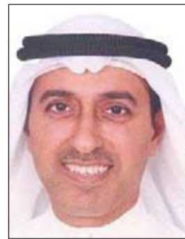
المستشار عادل العيسى

المحاضرين والاتفاقيات والدراسات والبحوث التي تعقد في المعهد وكلها تتعلق بالتدريب القضائي، مشيراً إلى أن بداية الاتفاقية اليوم هي أن أي برنامج يقدم في كلا المعهدين يتم إخطار المعاهد القضائية التي نبينا وبينها تعاون حتى تستطيع أن تشاركنا في الأنشطة التي نقوم بها كلا المعهدين. وعن اتفاقيات التعاون مع دول أخرى، رد قائلاً: لدينا اتفاقية تعاون الآن مع اليمن وسبق أن وقعنا اتفاقية مع المعهد المغربي، ولدينا اتفاقية مستقبلية