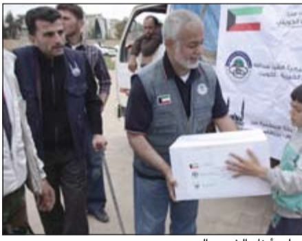
توزيع المواد الإغاثية على أبناء الشعب السوري