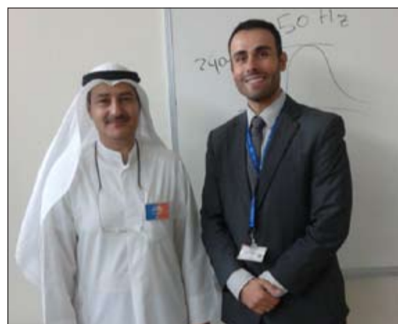
لقطة تذكارية بعد المحاضرة