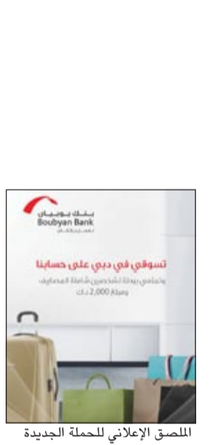
المسح الاعلاني للحملة الجديدة

أعلن بنك بويان (أفضل بنك إسلامي صاعد في العالم) عن إطلاقه إضافة جديدة مخصصة للسيدات على حملته الترويجية الحالية تحت شعار «بويان يحقق لك الكثير» والتي تمنحهن فرصة ربح تذكري سفر والإقامة في احد الفنادق الفاخرة في عاصمة التسوق في المنطقة (دبي) بالإضافة لبلغ 2000 دينار للتسوق في اكبر المولات