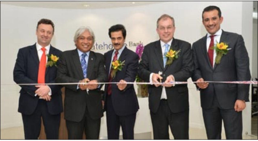
فهد بودي يفتتح رسمياً مكتب ماليزيا مع مجموعة من المسؤولين

أعلن بنك غايتهاوس، وهو بنك استثماري يلتزم بإحكام الشريعة الإسلامية ومبادئها ومقره مدينة لندن في المملكة المتحدة، عن افتتاح أول مكتب تمثيلي له بمدينة كوالالمبور في ماليزيا بترخيص من المصرف المركزي الماليزي، وناتى هذه الخطوة ضمن الجهود التي يبذلها بنك غايتهاوس لتوسعة نشاطاته في أسواق جديدة منها جنوب شرق آسيا.