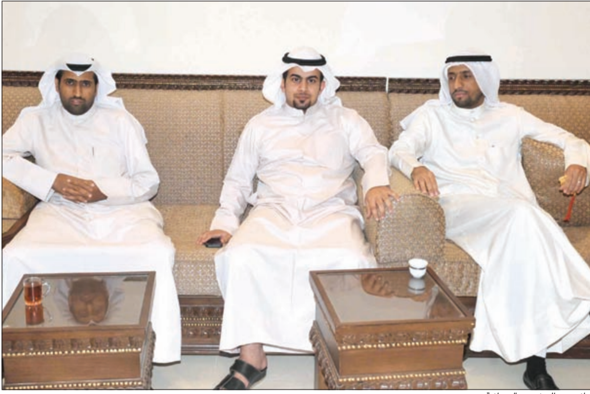
جانب من الحضور بالديوانية