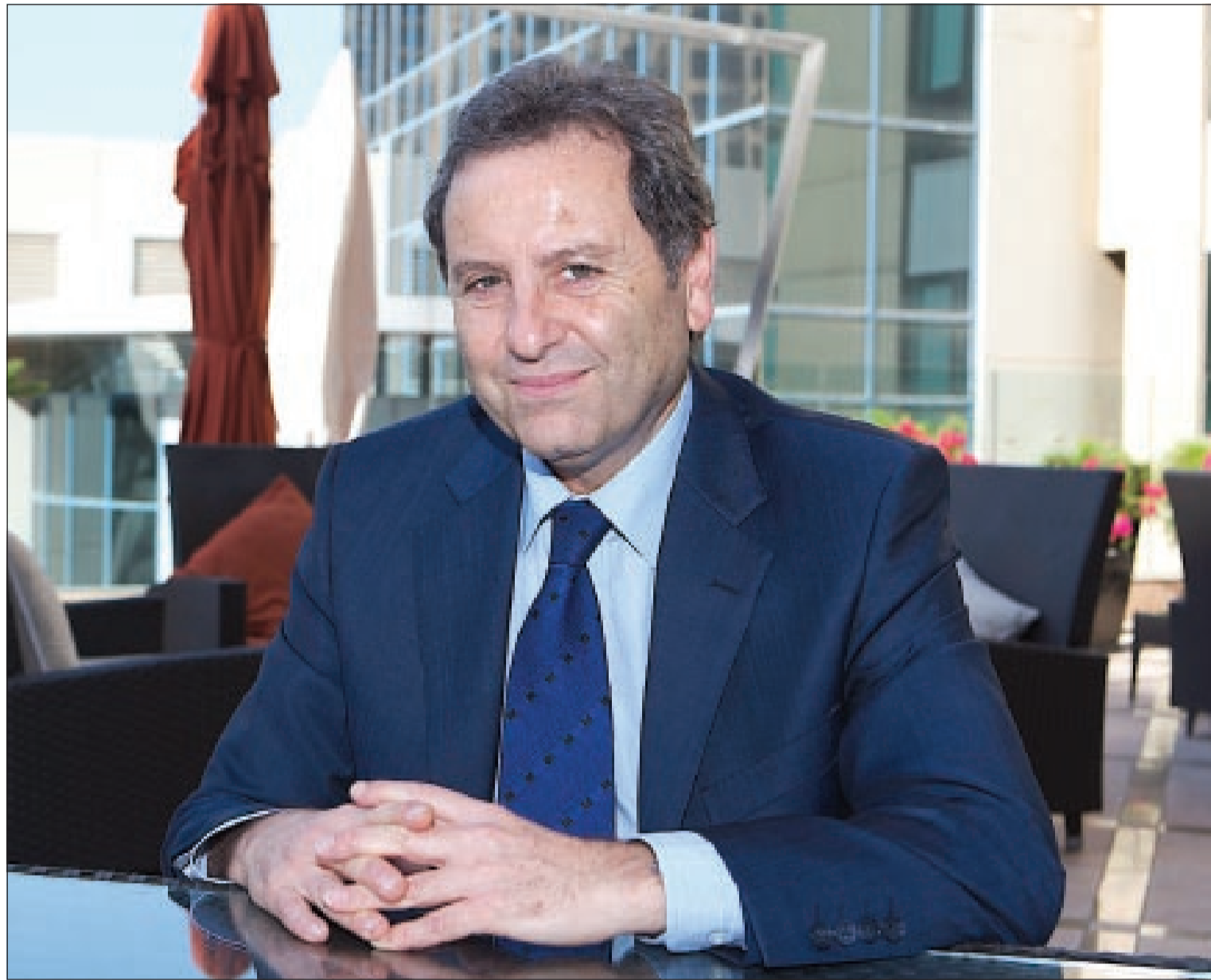
د. يعقوب حداد الخبير في العلوم الدوائية وطب الأطفال

ما سبب زيادة انتشار مرض السكري في الشرق الأوسط وإلى أي درجة تعتبر أنماط الغذاء الحديثة مسؤولة عن ذلك؟