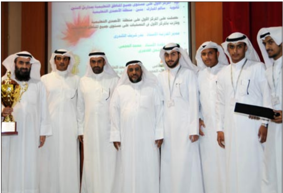
الطالبة وهيبة التدريسي ومدير المدرسة خلال توزيع الجوائز

دوره في خدمة الاقتصاد الوطني ودعم العمالة الوطنية، كما تطرقت إلى دور مجلس الإدارة والهيكل التنفيذي للبنك ودور الموارد البشرية في تحقيق أهداف البنك واستراتيجيته.