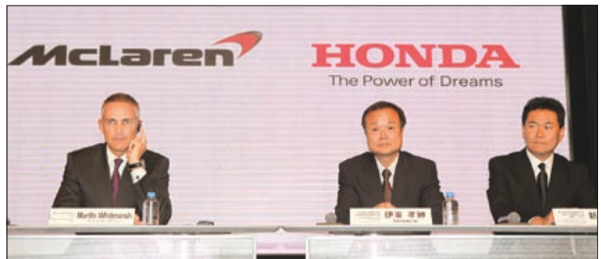
جانب من المؤتمر الصحافي لـ «هوندا» للإعلان عن العودة إلى سباقات فورمولا واحد

الجديدة، سيكون الحافز كبير لتحقيق المزيد من التقدم التكنولوجي في هذين المجالين وهو شيء لطالما طمحت هوندا لتحقيقه. وتعليقاً على هذا التطور المثير، يقول الرئيس وكبير المديرين التنفيذيين لشركة هوندا موتور هوندا تاكانوبو إيتسو: «نود أن نقدم امتناناً إلى السيد جان تود، رئيس الاتحاد الدولي للسيارات وإلى السيد بيرني إيكليستون، كبير المديرين التنفيذيين لمجموعة الفورمولا واحد، اللذين أظهرنا تفهماً عالياً وقدمنا تعاوناً كبيراً في مساعدتنا على تحقيق المشاركة في سباق فورمولا واحد. شعار شركة هوندا هو «قوة الإحلام»، وهذا الشعار يمثل رغبتنا الشديدة في السعي وراء أحلامنا وتحقيقها معاً مع عملائنا ومشجعينا. ويبدأ بيد مع مكلارين،