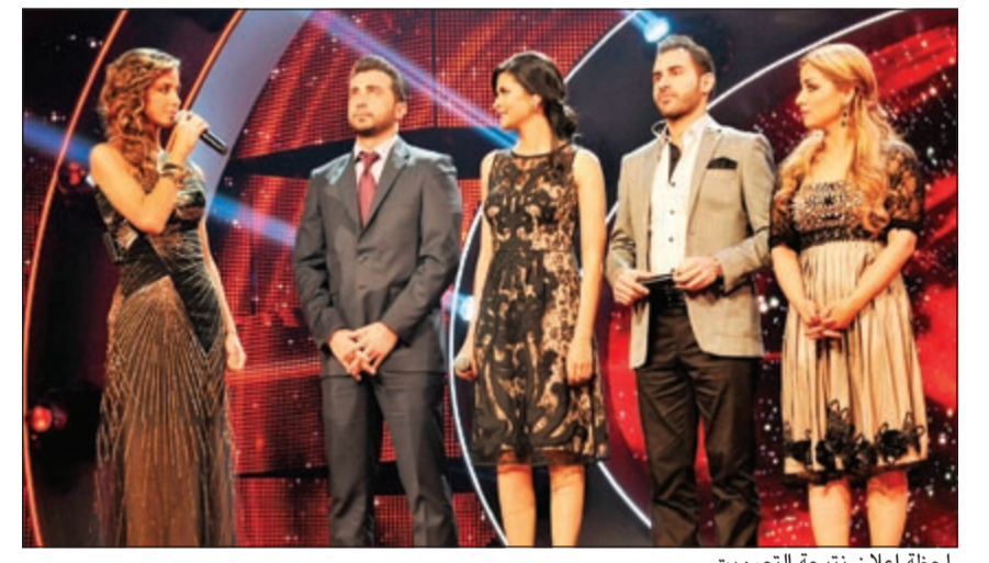
ماجد المهندس في البرنامج