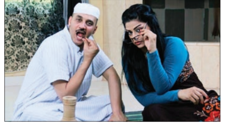
... وفي مشهد من «هشتقة»