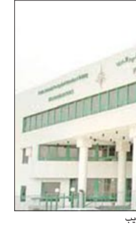
مبنى الهيئة العامة للتعليم التطبيقي والتدريب

جميعها، وضرورة دراستها مع سوق العمل والجهات المسؤولة، حتى تغلب على هذه المشكلة. وأشارت المصادر إلى ان هذه المشاكل لا تقع على مسؤولية الكلية وحدها، بل تقع على مسؤوليات جهات عدة في الدولة، مؤكداً ان الكلية هي جهة مسؤولة عن تخريج وتأهيل الطلبة فقط. وأوضحت المصادر أن التمريض مهنة انسانية من الدرجة الأولى، ومهمة للغاية مما دفع المملكة العربية السعودية الى تخريج أكثر من 47 ألف ممرض وممرضة، مما يدل على أهمية المهنة، لافتة إلى أن الكويت لديها 1000 ممرض ومرمضة على مدى سنوات، مع الحاجة فعلياً للممرضين مع التوسعة في المستشفيات في وزارة الصحة.