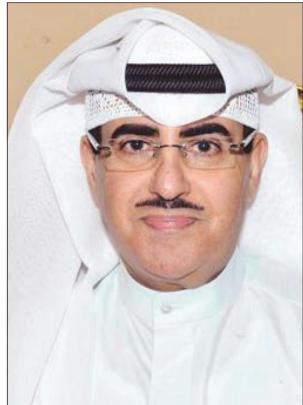
وكيل التلفزيون الشيخ فهد المبارك

عاش محبو صوت قيثارة الخليج ساعات مليئة بالرومانسية والإحساس الصادقة من خلال الأغاني التي قدمتها لهم مطربتهم «الراقية» نوال الكويتية التي شهدت قاعة «الراية» بفندق كورت يارد عودتها بقوة لأجواء الحفلات الغنائية بعد أن غابت عنها لسنوات ولتقدم أجمل ما غنت في مشوارها الغنائي الطويل لجمهورها الذي نظم هذا الحفل من أجله كان لسان حالها يقول «مستحيل أنساك».