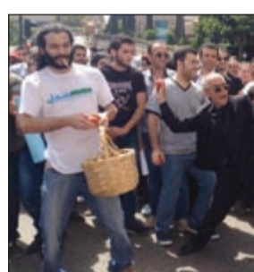
معارضون للتمديد يرشقون صورة للنواب كتب عليها، «فشلتم في كل شيء» بالبنطام

الجريدة الرسمية لاحقاً. في هذا الوقت، قام محتجون على التمديد للمجلس النيابي بالتجمع في ساحة النجمة وعمدوا إلى رشق سيارة أحد النواب القادمين إلى الجلسة بالبندورة (الطماطم).