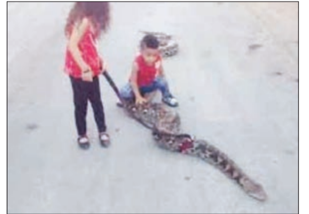
الطفلة تلهو مع الثعبان

نشر فلسطيني مقطع فيديو على يوتيوب لابنته وابنه وهما يتنزهان مع أفعى ضخمة في رام الله. ولاقي الفيديو الكثير من ردود الأفعال ما بين مستهجن ومنكر لهذا الفعل خاصة أن الأفعى ضخمة جداً، ووجهوا نقداً لاذعاً للاب على فعلته هذه، في حين رأى البعض أن الأمر يعد عادياً لأن الأفعى - حسب قولهم - غير سامة.