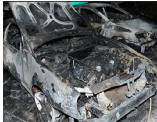
المركبات لحقت بها اضرار جسيمة

وعلى الفور كافح رجال الإطفاء الحريق وتم اخماده بدون وقوع اي اصابات، حيث اقتصر الحريق على الماديات فقط، وجار التحقيق في الحادث لمعرفة اسباب الحريق. وتمكن من جهة أخرى، تمكن رجال الإطفاء من السيطرة على السنة لهب اندلعت في محل للبشوت في منطقة المباركية وأسفر الحريق عن خسائر مادية، وقال مدير ادارة العلاقات العامة في الإطفاء العميد خليل الأمير انه ورد بلاغ من مركز العمليات في الحادية عشرة من مساء امس الاول عن وجود حريق محل في