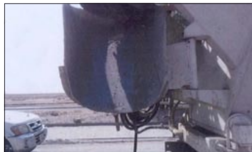
مخالفة شروط امن وسلامة حررت للسيارات المخالفة