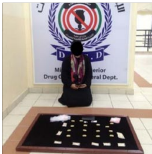
الاسويية وامامها المضبوطات

تمكن رجال الإدارة العامة لمكافحة المخدرات من ضبط وافدة أسويية بحوزتها مواد مخدرة ومؤثرات عقلية تقدر بربيع كيلو هيروين و(50) حبة روش بعد ورود معلومات سرية إلى رجال مكافحة عن قيام وافدة أسويية بالتجارة في المواد المخدرة والمؤثرات العقلية داخل البلاد، وعلى الفور تم تشكيل فريق لجمع الاستدلالات والقيام بالتحريات، وبناء عليه تم اتخاذ الاجراء القانوني اللازم لضبطها، وبتفتيش