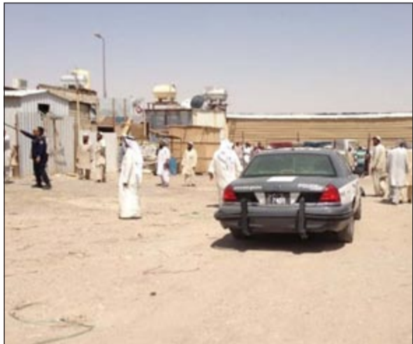
أمن الجهراء تواجدهم برفقة بلدية الكويت