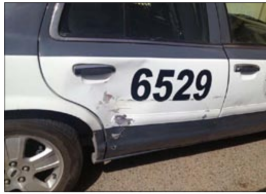
الدورية التي تعرضت للاتلاف

حتى تعرضوا للرشق بالحجارة ما أدى إلى إصابة الضابط الذي تلقى العلاج امس. وقال مصدر امني انه بناء على تعليمات من مدير أمن الجهراء اللواء إبراهيم الطراح، تم ضبط 3 مستهترين. ونفى المصدر صحة ما أشيع عن إطلاق نار على رجال الأمن.