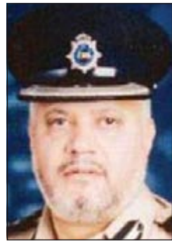
العميد غازي اللميع

لمباحث الهجرة بالإنيابة العميد غازي اللميع عن أن أسويين يعيد تأهيل الطوابع وبيعها إلى المندوبين باعتباره يعمل لدى إحدى الشركات المعنية ببيع الطوابع. وقال المصدر: تم القبض على الوافد وبالتحقيق معه اعترف على آخر، وهو من الجنسية البنغالية أيضاً وارشدا عن غرفة يقومان باستغلالها لإعادة