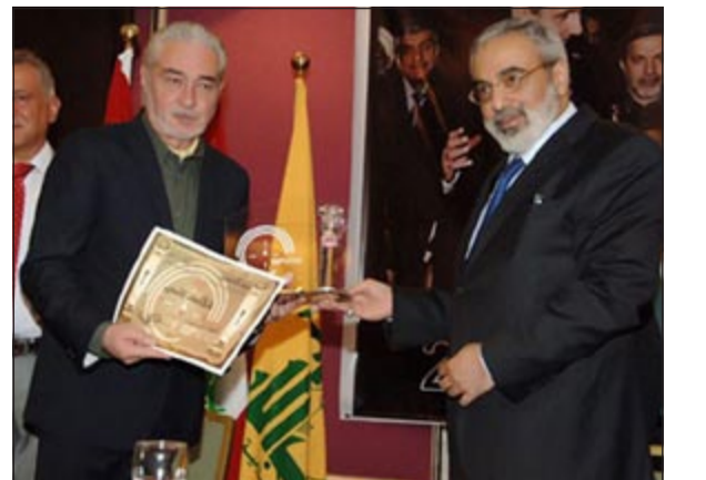
وزير الإعلام السوري عمران الزعبي يكرم نجدة أنزور

عواصم - وكالات: منح وزير الإعلام ونائب وزير الخارجية في سورية المخرج نجدة أنزور درعا تكريمية في مهرجان «عيد