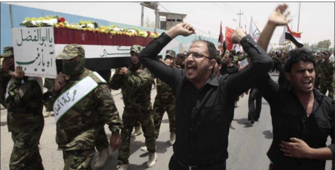
عراقيون في البصرة يبكون احد مقاتلي الشيعة قتل في المعارك ضد الجيش الحر في مدينة القصور