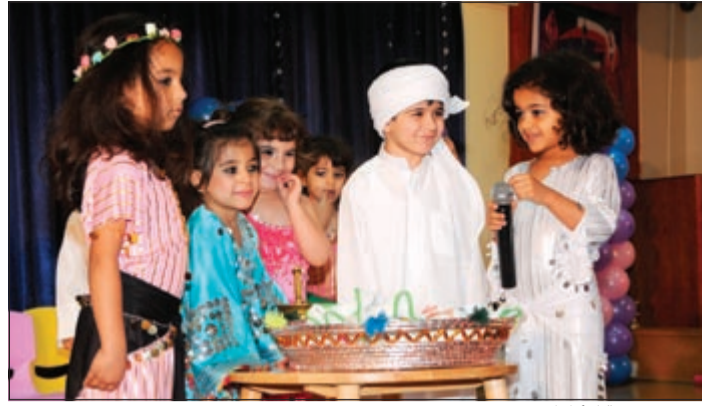
فقرة مسرحية للأطفال