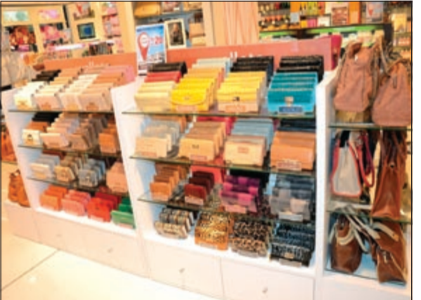
من منتجات لايف ستايل

وأضاف: يسعدنا إطلاق المتاجر الثلاثة في الفروانية، ونتطلع قدماً لإطلاق متجرين إضافيين تابعين لـ«ماكس» ومتجر آخر لـ«شيو إكسبريس» و«لايف ستايل» في الكويت، قبل نهاية العام الحالي.