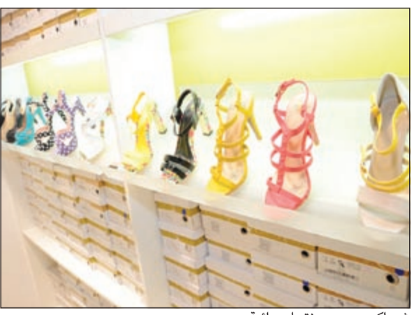
شيو إكسبريس ومنتجات راقية