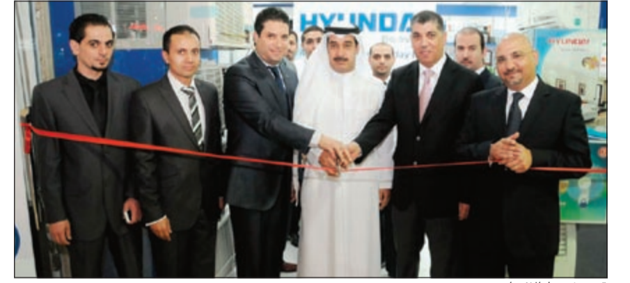
قص شريط الافتتاح

في الكويت وتحديدًا في منطقة الفحيجيل ومن أكثر المعارض جاذبية من حيث الديكور وترتيب العرض بشكل احتراف جداً، بالإضافة إلى حرصه الدائم على وجود فريق مبيعات محترف يعمل دائماً على تلبية حاجات العملاء وإرضائهم وتأمين الأسعار المناسبة والمنافسة في السوق المحلي وتوفير خدمة البيع بالأقساط أيضاً.