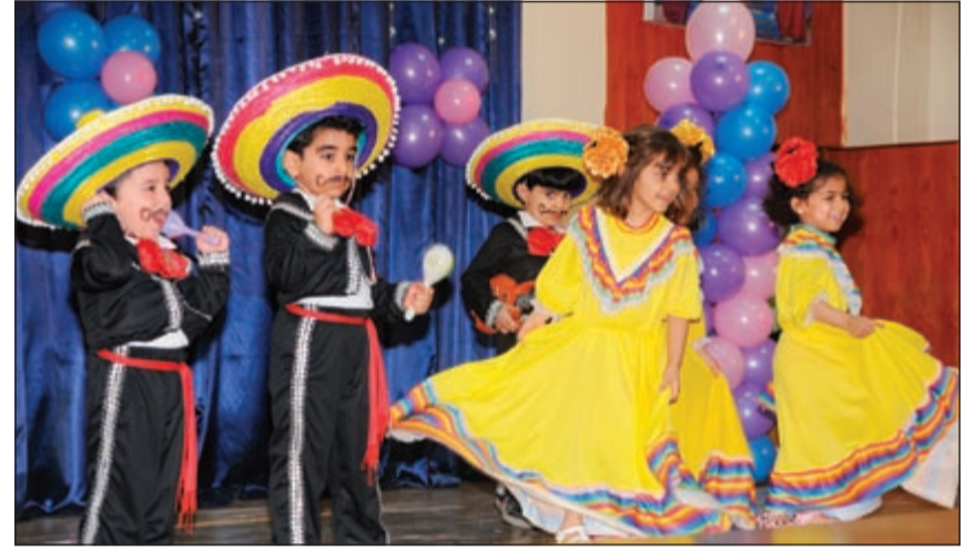
البراعم يؤدون إحدى الفقرات

تعليمهم التالية، مشيرة إلى أن حفل التخرج كان بمنزلة رحلة فنية طاف فيها أطفال الحضانة بعض دول العالم، وفي الختام عادوا إلى ديارهم الكويت.