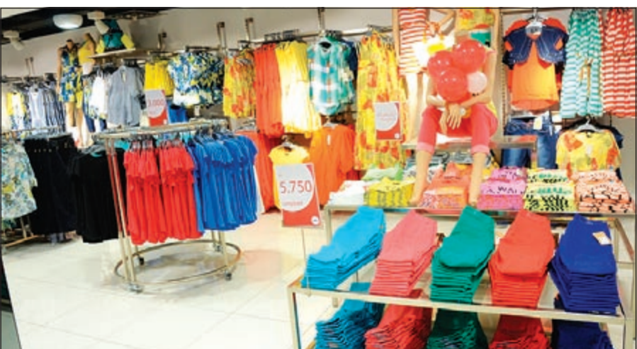
أزياء متنوعة من ماكس