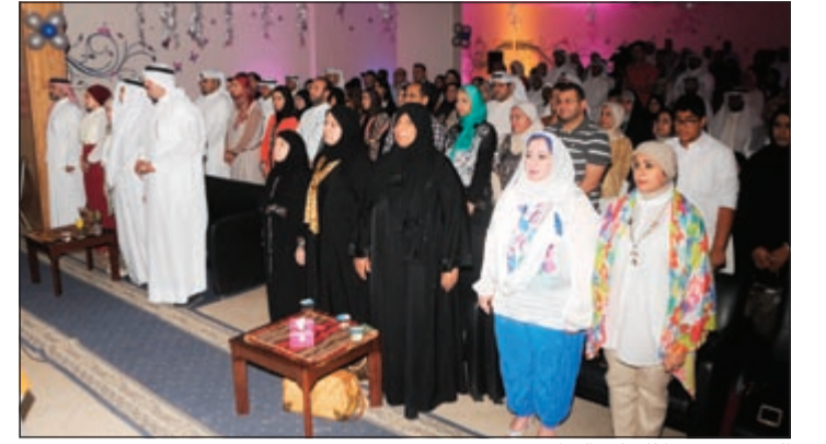
الحضور وقوفاً للسلام الوطني