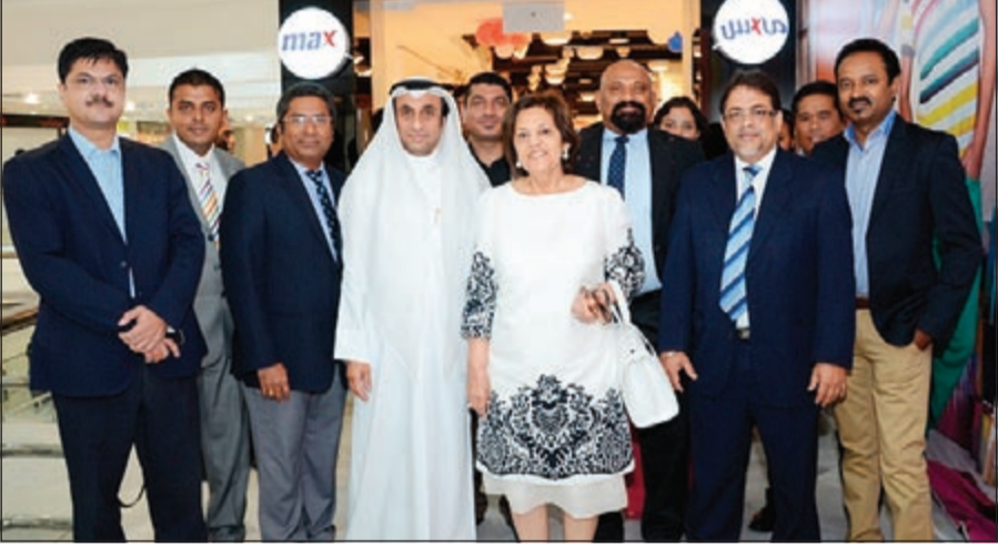
لقطة تذكارية بمناسبة الافتتاح

من متاجر «ستريوبينت» في الراي ومجمع اللوان، والآن في الفروانية. أما «شيو إكسبريس» فتتطلع إلى توفير أفضل الخدمات عبر تجربة تسوق مريحة لاختيار الأحذية والاكسسوارات بما يتناسب مع متطلبات العملاء من جميع الأعمار. حرص العلامة التجارية على تزويد العملاء بأحذية فاخرة ذات جودة عالية المستوى وتراعي أحدث الصرعات في عالم الموضة وبأسعار مناسبة. وتقع منافذ العلامة التجارية في مجمع سيتي ستارز في الراي بجانب الدائري الرابع في المباركية، والآن في الفروانية. وأنتجت «لاندمارك» جدارتها كرائدة في سوق تجارة التجزئة في الشرق الأوسط، كونها السبقة دوماً في تزويد العملاء بمنتجات ووسائل راقية تحقق قيمة مضافة مقابل التكلفة.