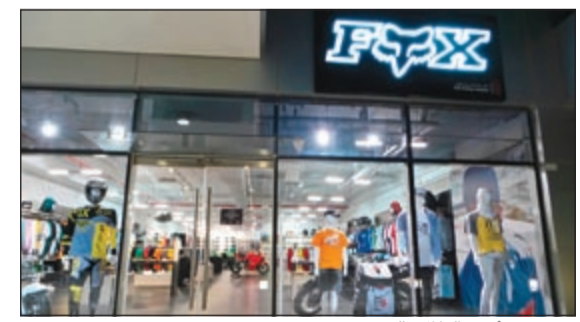
معرض FOX في التلال بالشويخ

على تاريخها العريق في مجال الملابس الرياضية، مما جعل من منتجاتها عالية الجودة من حيث نوعية المواد الأولية الأصلية الداخلة في تصنيعها والمصنوعة بتقنية متطورة من حيث التصاميم والأشكال، كما ان علاقتنا مع علامة FOX تمتد إلى 25 سنة من التعاون المحرم والنساء، لذلك كانت خطوة افتتاح معرض (FOX) لتظهر التوسع الكبير من حيث اختيار المنتجات المعروضة، كما أننا سعداء بان نضع بين ايدي عملائنا اثنين من أفضل العلامات التجارية في العالم وهما DC و Alpinestars، حيث تمثلان خطين مميزين من