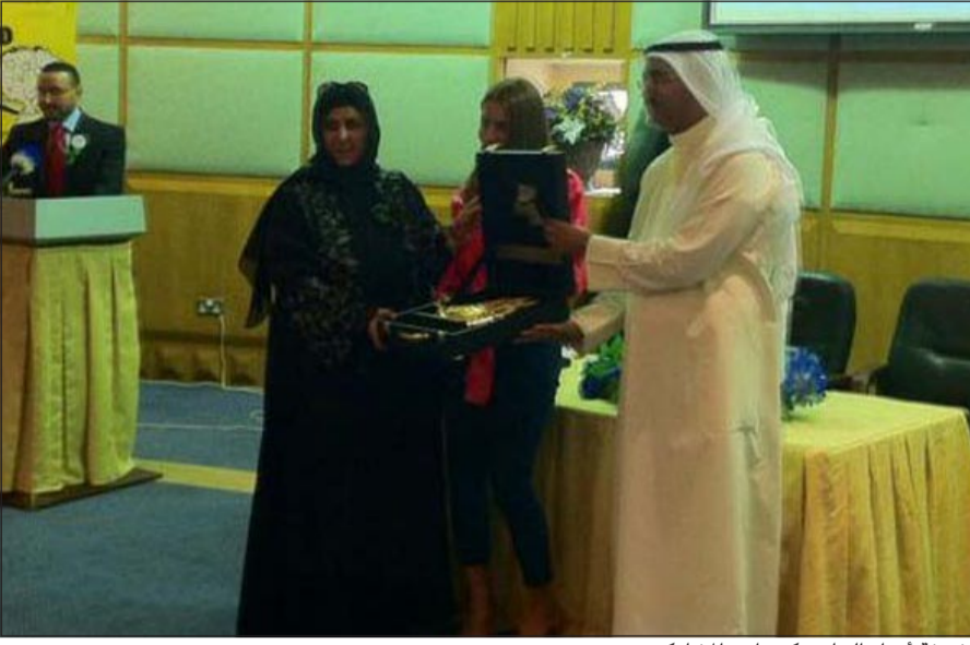
الشيخة أورد الجابر تكريم احد المشاركين

بحفل به عالمياً، لافتة الى أن الحملة كانت ناجحة بشكل كبير وتم العمل خلالها على تقليل الوصمة المصاحبة للطب النفسي والأمراض النفسية والمريض. لافتة الى أن الهدف الرئيسي للحملة يكمن في رفع الوعي المجتمعي بأهمية الصحة النفسية وإزالة الوصمة المصاحبة للمرض النفسي والمريض النفسي، والتعريف بحقوقه كفرد فعال، والتي كانت موجهة الى فئات عديدة من المجتمع من أطباء الرعاية الأولية والتربويين والاختصاصيين النفسيين والاجتماعيين في كل من وزارات التربية والأوقاف والشؤون الإسلامية والداخلية والدفاع ومعهد الكويت للأبحاث العلمية.