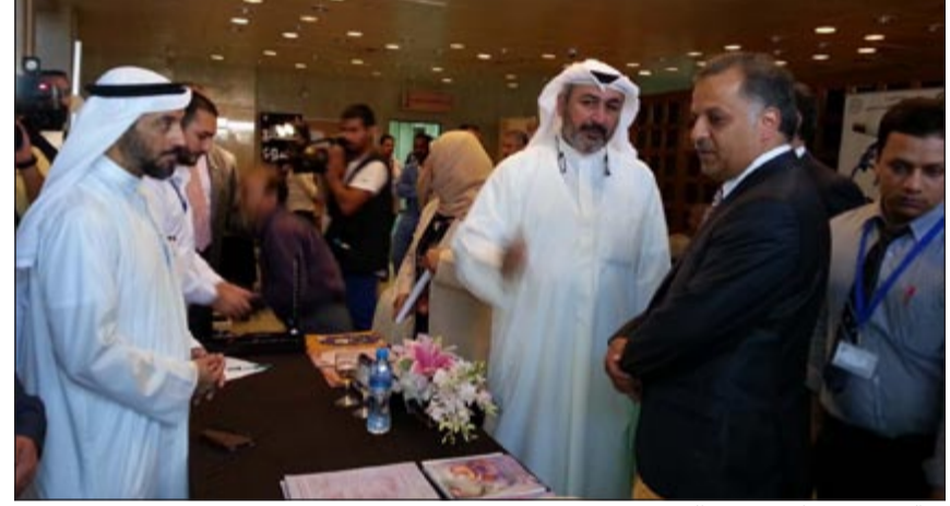
د. الهيبي في حوار مع بعض الحضور

أكد وزير الصحة د.محمد الهيبي ان اللجنة الوطنية لمكافحة التدخين بوزارة الصحة قدمت عدة إنجازات في مجال مكافحة التدخين من أهمها وضع خطة وطنية لمكافحة التبغ، ورفع الضريبة الجمركية بنسبة 100٪ على التبغ ومنتجاته وتطبيق قانون منع التدخين في مرافق وزارة الصحة، وكذلك السعي الي تطبيقه بالمرافق الحكومية الأخرى، إضافة الى التعاون مع وزارة التربية لإدخال مادة عن أضرار التبغ في المناهج الدراسية ودعم وإنشاء عيادات «لا للتدخين» في جميع المناطق الصحية، بالإضافة الى صدور قرار وزاري يحظر التدخين في الأماكن العامة بما فيها المطاعم والفنادق والمقاهي وذلك للحد من ظاهرة التدخين.