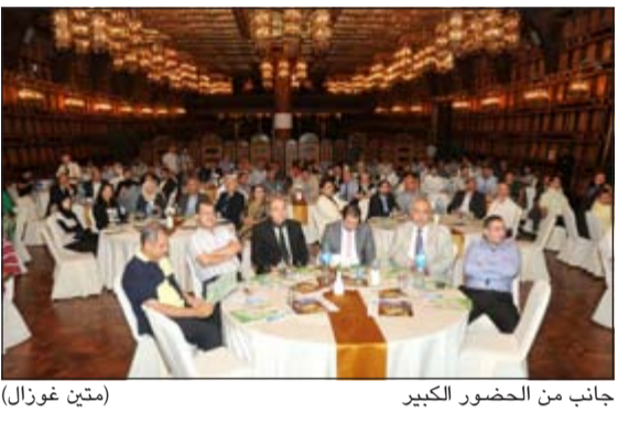
جانب من الحضور الكبير

المباني الذكية فستعمل في حال أي طارئ قد يحدث عن طريق مجسات تعمل على مبدأ الطوارئ وتكون جاهزة للاستخدام في حال أي شيء قد يحدث بما في ذلك كاميرات لتسجيل أي شيء يحدث خلال فترة الاستخدام وأعطى مثالا على ذلك وهو إدارة المدارس دون إدارة لطرقت استهلاك او أجهزة النقل.