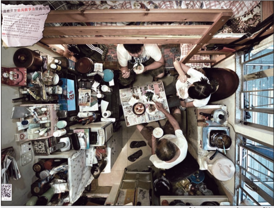
عائلة من هونغ كونغ تعيش في «علبة»