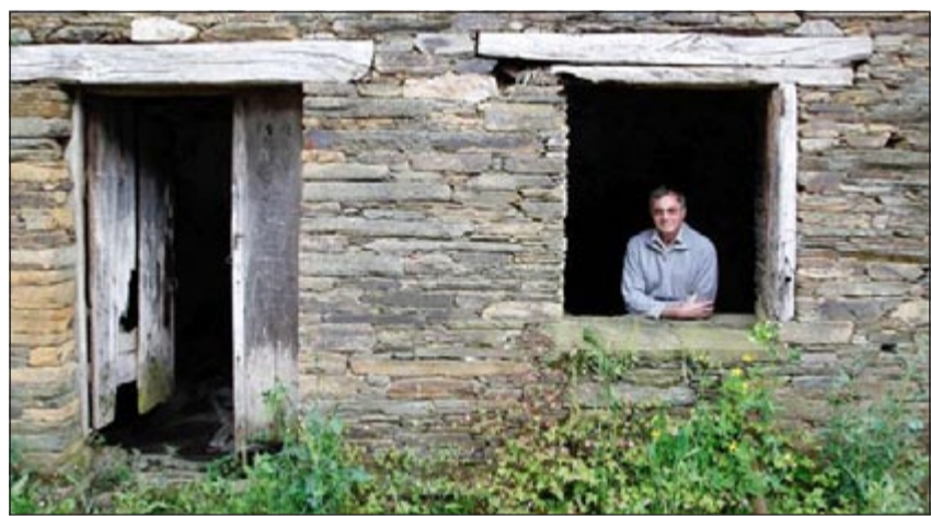
تيل كريستي في أحد منازل «قرية»

وكالات: نجح رجل أعمال بريطاني في إتمام ما أسماه بـ «صفقة العمر»، وذلك بعد أن تمكن من شراء قرية إسبانية مهجورة بأكملها مقابل 58 ألف دولار فقط، وهو سعر وصفته صحيفة «ميرور» البريطانية بالـ «زهيد»، والذي يقل عن أسعار المنازل الصغيرة في بريطانيا.