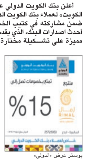
يوسر عرض «الدولي»

وأوضح التقرير أيضا أهم الهياكل المستخدمة من قبل مصدري الصكوك الدوليين بالإضافة إلى هياكل الصكوك المستخدمة على المستويات المحلية في مجال مختلف سلطات الاختصاص التي تنشط في مجال إصدار الصكوك. ويتضمن التقرير أيضا مجموعة مختارة من دراسات الحالات في سوق الصكوك الدولية وتقدم فيها أعمق لألفية والميزة الفريدة لعظم الأدوات الخابئة المستخدمة بشكل شائع في أسواق رأس المال وأسواق المال الإسلامية.