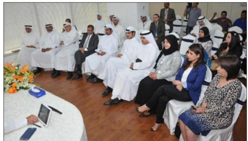
جانب من حضور قيادات «وربة» في الجمعية العمومية