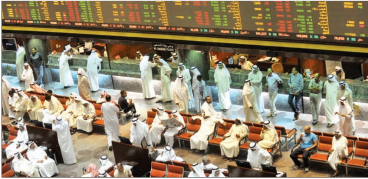
استمرار الأداء القوي للسوق لثاني جلسة على التوالي