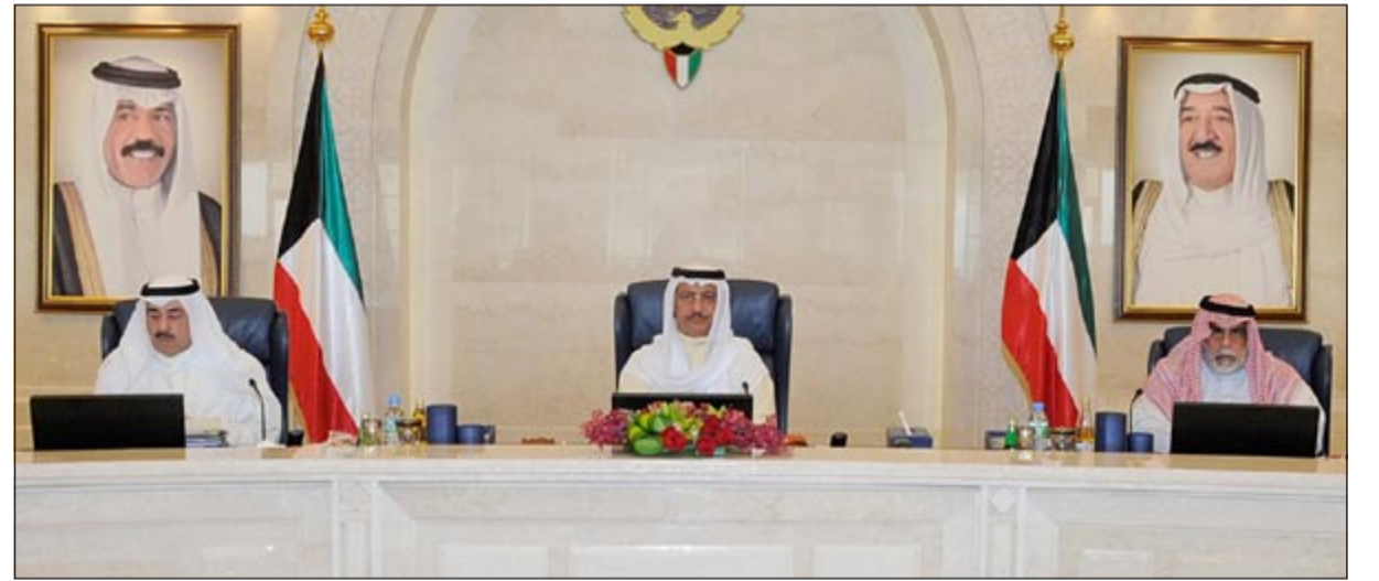
سمو الشيخ جابر المبارك مترشحا الاجتماع ويبدو الشيخ أحمد الحمود والشيخ أحمد الخالد

الإدراج في السوق بصفة الأولوية عن طريق إصدار الهيئة القرار رقم 3 لسنة 2011 بورصة الأوراق المالية، كما تم اتخاذ الإجراءات لتحقيق المرونة لإنجاز المعاملات بوضع فترات سماح زمنية لتوفيق الأوضاع وذلك للالتزام ببعض المتطلبات التنظيمية والرقابية التي تستدعي ذلك. وأصدر مجلس الوزراء توجيهها للوزراء بإحالة شاغلي الوظائف الإشرافية بصفة أصلية ممن لديهم إجمالي مدة خدمة مسجلة لدى المؤسسة العامة للتأمينات الاجتماعية لا تقل عن 30 سنة إلى التقاعد بمراعاة أحكام المادة 76 من نظام الخدمة المدنية وذلك اعتبارا من 30 سبتمبر 2013.