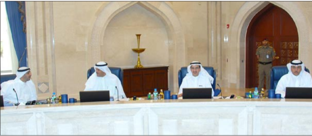
الوزراء الشيخ سلمان الحمود والشيخ محمد العبدالله وم.عبدالعزیز الإبراهيم وم.سالم الأذينة