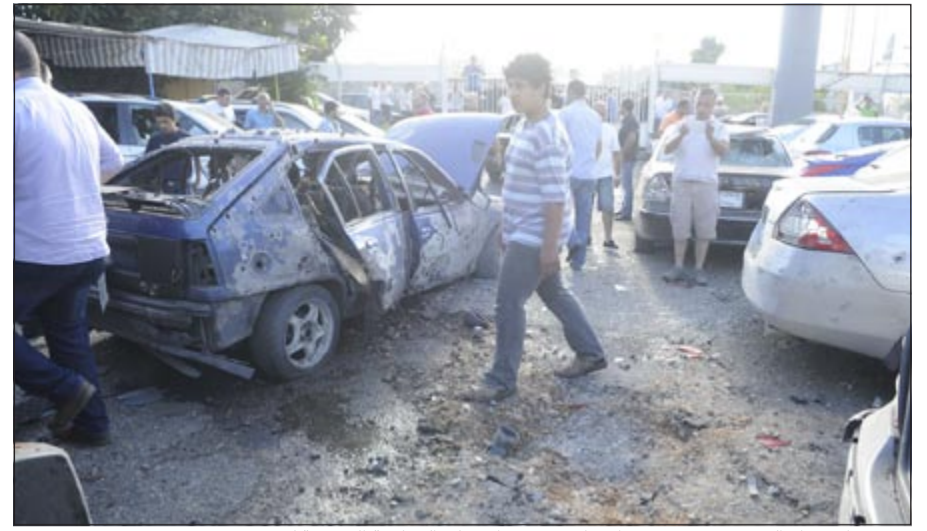
الاضرار التي نجمت عن سقوط صاروخي «غراد» على الضاحية الجنوبية لبيروت

لبنان، فهي الوحيدة القادرة على مواجهة العدو الإسرائيلي والوحيدة القادرة على فرض هيبتها على اللبنانيين. وكان الأمين العام لحزب الله حسن نصرالله أرسى معادلة جديدة اسقط فيها اي بحث في الاستراتيجية الدفاعية، التي لطالما كانت محور لقاءات هيئة الحوار الوطني بدعوتها الاطراف اللبنانية الداعمة للنظام السوري او الداعمين للمعارضة، الى التقاتل بين جبهة القصر في سورية تجنبا لنقل الصراع الى لبنان. وأشار نصرالله الى خطرين إسرائيليين وتكفيري مشرعا قتاله في سورية على هذا الاساس.