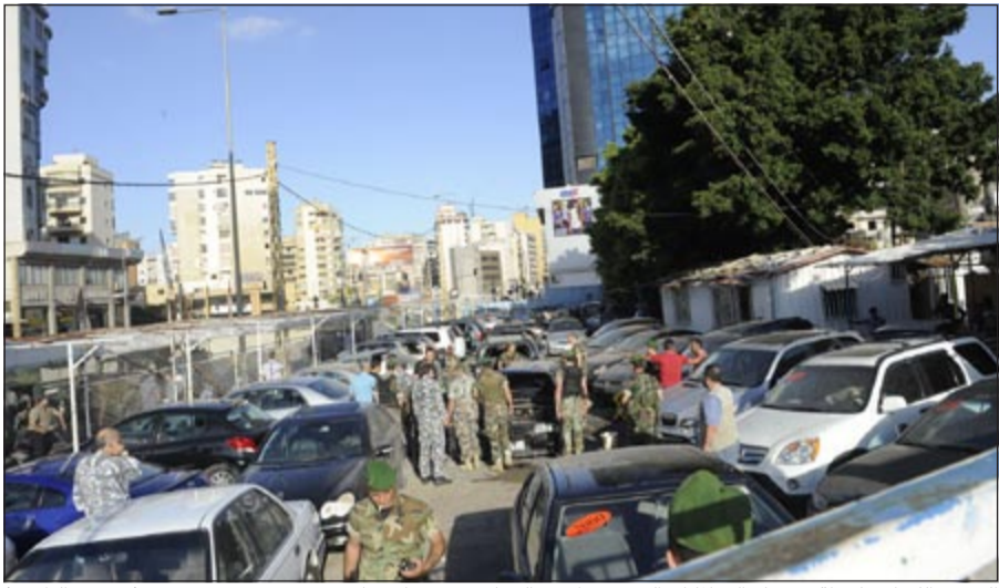
الجيش اللبناني لحظة وصوله إلى المكان الذي سقط فيه الصاروخ في مارمخايل