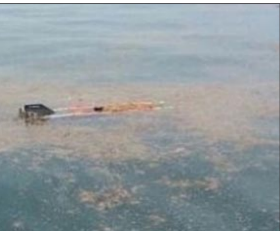
طائرة التجسس الإيرانية