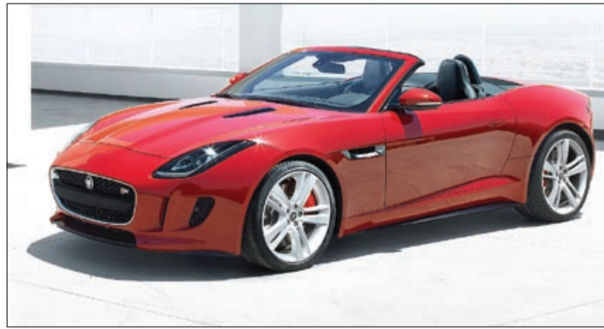
تطور هائل في التصميم الأمامي للسيارة

«خطن انسيابيين» يشكلان جناحي القسمين الأمامي والخلفي من السيارة، ويعكس تصميم المقصورة دورها كسيارة «One plus one» رياضية تركز على السائق وتفاعله مع المكونات الإلكترونية والميكانيكية التي تجتمع معاً لخلق تجربة أكبر مما يعبر عنه مجموع أجزائها، وتتضمن المقاعد الرياضية تقنية التعديل