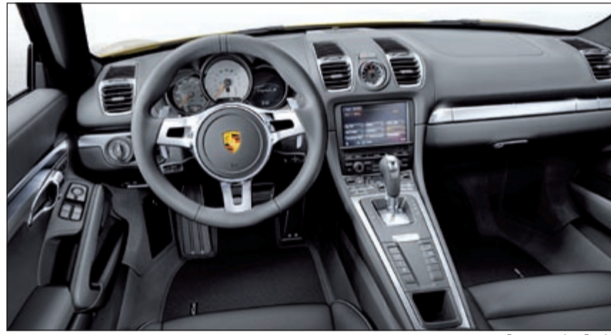
كابينة قيادة عصرية

خاصة نتيجة انخفاض ارتفاع الجسم مسافة 10 ملم وتقليص المسافة بين مقدمة السيارة والعجلتين الأماميتين بمقدار 26 ملم، على الرغم من ذلك، حافظت السيارة الرياضية على حجمها المدمج، بعد أن ازداد طولها بمقدار 33 ملم فحسب، ومن السمات المرئية الأخرى التي تلبع دوراً حيوياً في الإشارة إلى أداء السيارة الأفضل، إلى جانب قاعدة العجلات الأطول والمسافات الأقصر بين العجلات وطرفي الجسم، عجلات بقطر 18 و19 بوصة مع محيط دوران أكبر، وصورتها الظلية المتدنية والامتدة، نتيجة اعتماد واجهة زجاج أمامية أقرب إلى المقدمة بحوالي 100 ملم تقريباً وخط سقف يمتد إلى أقصى الوراء.