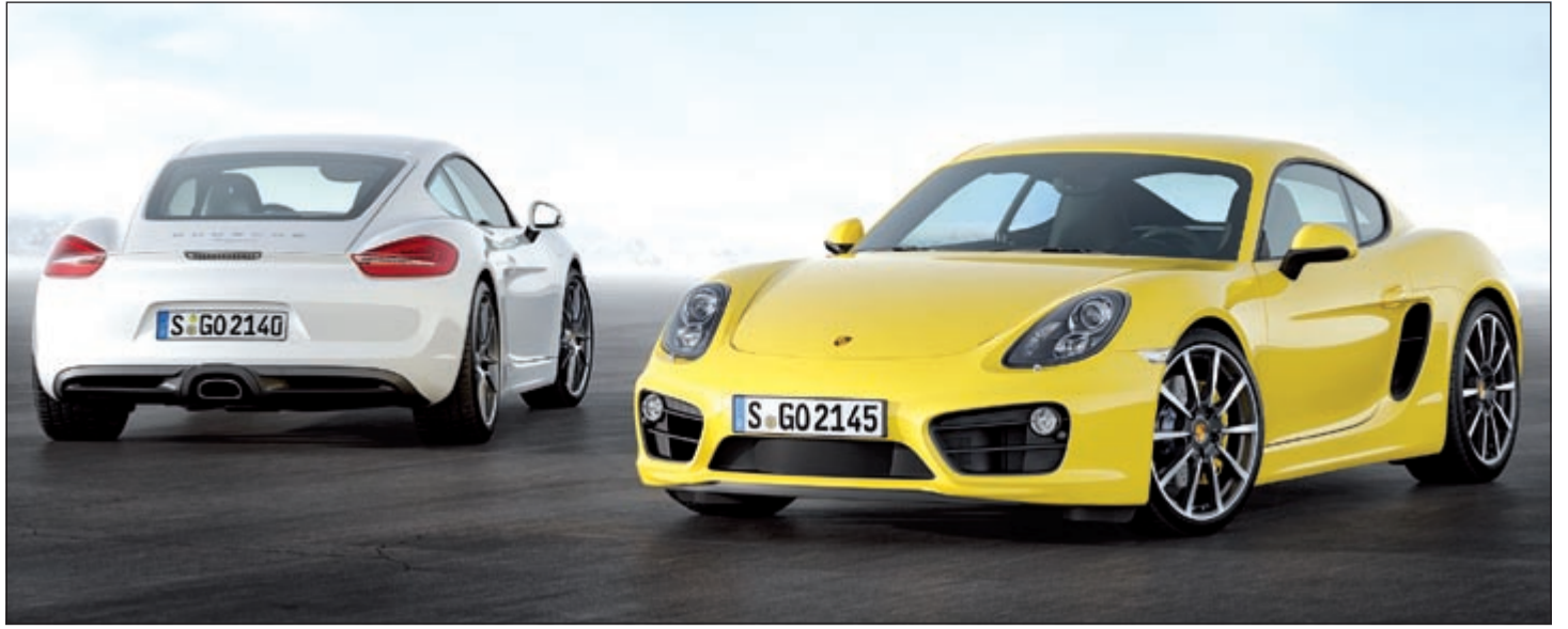
تصميم عصري جديد بكل المواصفات لـ «كايمن» من بورشه

وتيسر ودون العبادات والتابولوه الأمامي غنية بالأنافة والعصرية بوجود شاشة تواصلية 6,5 تعمل باللمس بنظام MyLink الذي يدمج محتوى ومزايا الهاتف