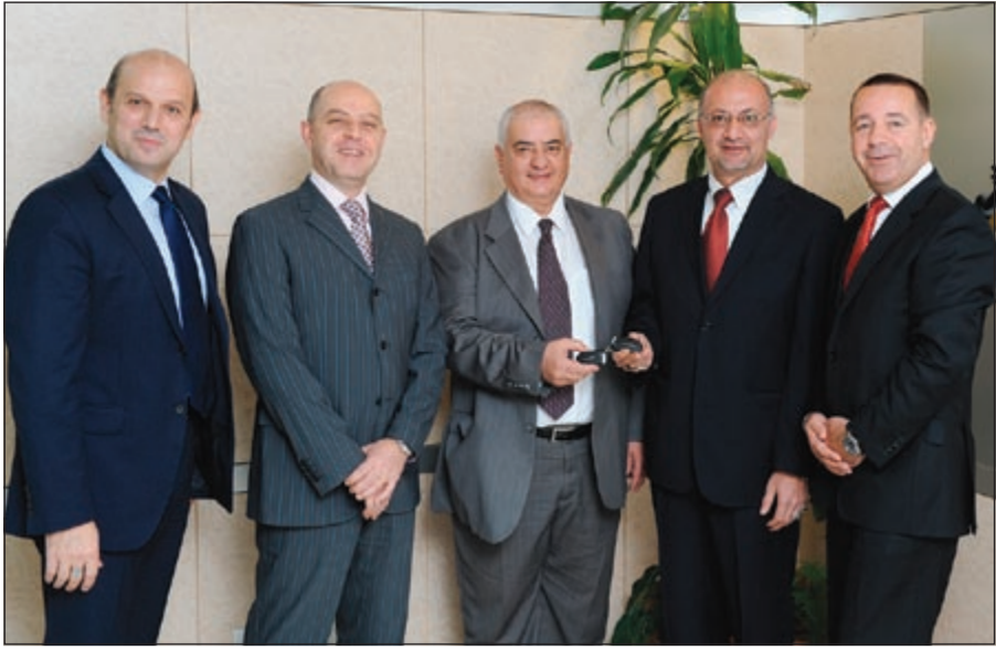
لقطة جماعية لقيادات «الملا»