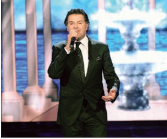
راغب علامة وصلته الغنائية