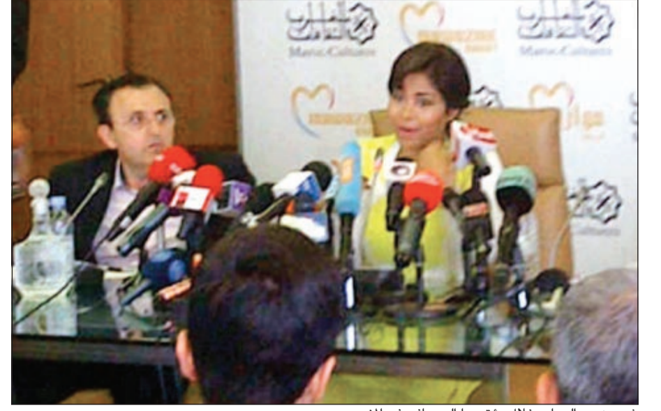
شيرين عبدالوهاب خلال مؤتمرها الصحفي في المغرب