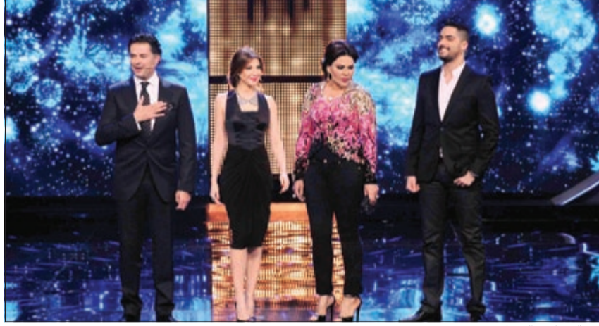
لجنة تحكيم البرنامج