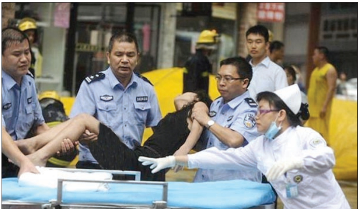
الصينية بعد إنقاذها

لم تحصل على سيجارة من أي أحد. وعندما لم يستجيب أحد لطبها، تسلقت سور الشرقة