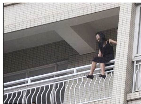
الصينية خلال فترها من الشرقة

بالفعل، وهددت بالانتحار عبر إلقاء نفسها، علماً بأنها كانت في الطابق الخامس آنذاك. وتم استدعاء الشرطة لمعالجة الأمر، بعد أن سادت حالة ذعر في أرجاء المستشفى، حيث قام أحد ضباط الشرطة بتقديم سيجارة للسيدة الصينية، ثم سيجارة أخرى، حتى السيجارة الخامسة، حتى تمكن من الإمساك بها وإدخالها إلى الشرقة مرة أخرى وإنقاذ حياتها، وتم حملها إلى وحدة الطب النفسي.