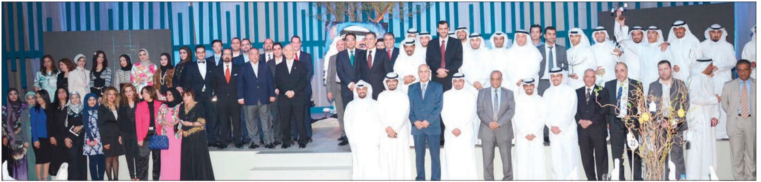
الحفل الأول لـ «المتحد»