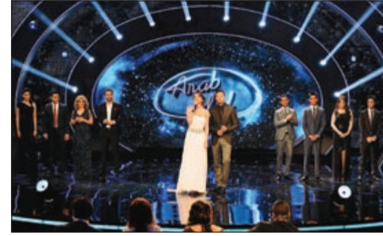
المتسابقون في البرنامج