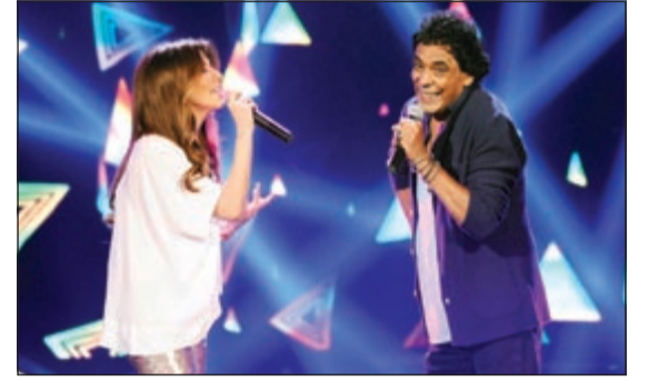
الكينغ محمد منير يغني مع نانسي

البرامج التي تقدمها «MBC» في البحث عن المواهب تدعم تواصل الأجيال لأنها تضم خبرات غنائية وموسيقية متنوعة في لجان التحكيم