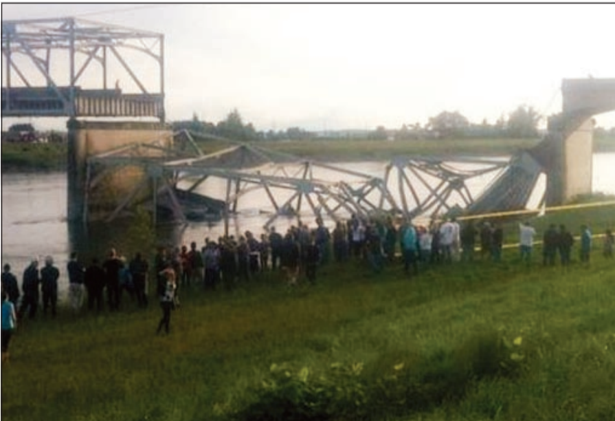
الجسر بعد انهياره

انهيار الجسر، الذي وقع على بعد نحو 60 ميلاً، أي ما يقرب من 96 كيلومتراً، إلى الشمال من مدينة سياتل، وأعلن فرانسيس أن إدارة النقل في ولاية واشنطن بدأت التحقيق في الحادث.