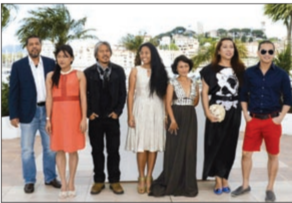
نجوم في «كان»

وبين عدة أسماء في مقدمتها الأميركي المخضرم بروس ديرن عن فيلم «نبراسكا» مجسداً دور رجل متقاعد يعتقد انه ربح مليون دولار من خلال مشاركته في إحدى الصحف، لكنه حينما يكتشف لعبة الصحيفة يكون قد كسب إعادة تجمع أسرته حوله.