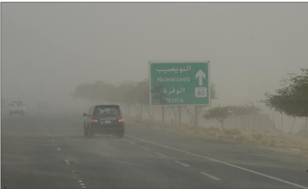
انعدام الرؤية نتيجة هبوب الرياح

وحول أسباب موجة الغبار التي هبت على البلاد أمس قال العجيري ان سببها هبوب رياح شمالية متقاوثة القوة وحملة الغبار من المنطقة