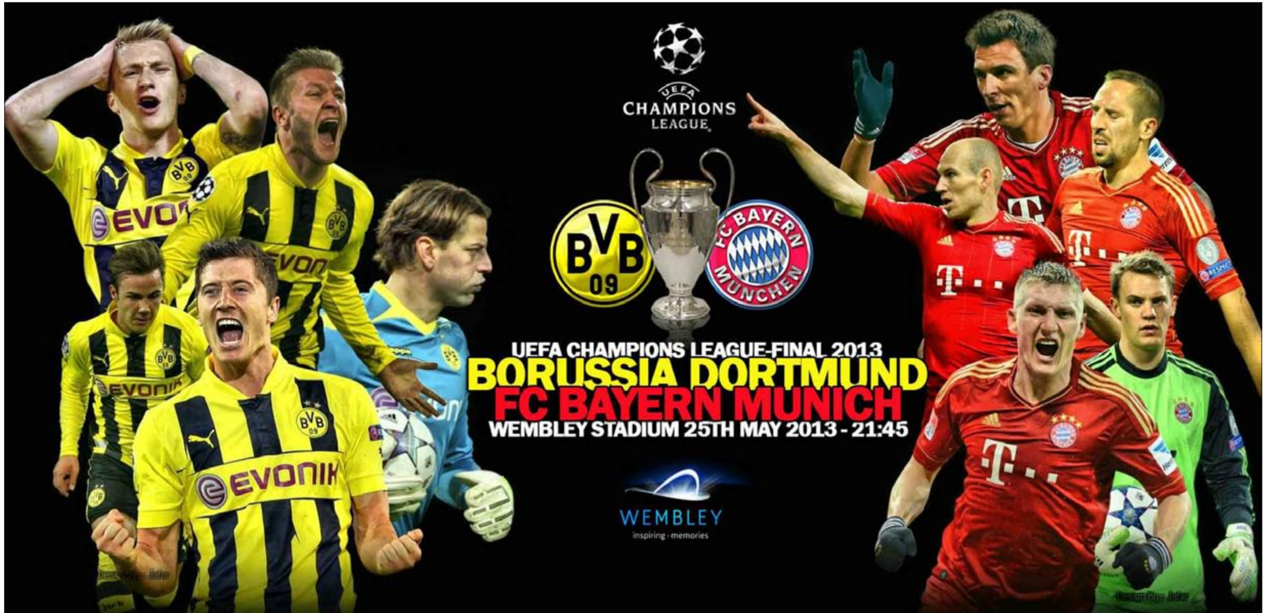
تجوم بايرن ميونخ يعدون لاعبي بوروسيا دورتموند في نهائي دوري أبطال أوروبا على ستاد «ويمبلي»