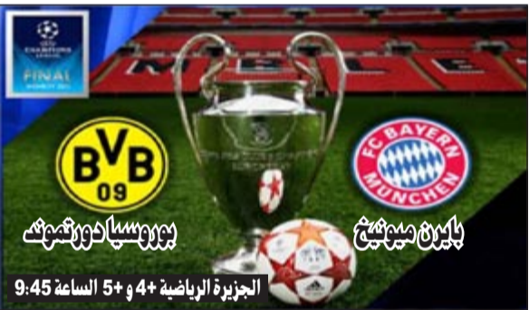
الجزيرة الرياضية +4 و 5+ الساعة 9:45

بإحراز لقب الدوري عامي 2011 و2012. اتقن لعب دور «الطفل الهائج» بلسان سليل، محتفلا بأهداف لاعبيه بعد مسابقات طويلة وحركات مسعورة بالأيدي. مزاجه نقىض لصورة هاينكس، ولو ان الاخير السلطوي لقب سابقا «اوسرام» (ماركة لمبات) نظرا لاحمرار جبينه العريض عندما يغضب. على المقعد، يتميز المدربان بقدرتهما على استخراج افضل ما لدى لاعبيهما. يستحق هاينكس ميزة المحافظة على لحة فريقه لتحقيق اهداف النادي، هذا بدون ان ينجح في تفادي قضايا الغرور في ميونخ.