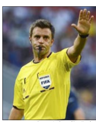
الحكم الإيطالي نيكولا ريزولي

قال الحكم الإيطالي نيكولا ريزولي الذي سيدير مباراة الأبطال بين بايرن ميونخ وبوروسيا دورتموند اليوم إنه يشعر بالفخر لأنه سيدير تلك المباراة التاريخية. وأضاف بقوله في مقابلة مع موقع الاتحاد الأوروبي لكرة القدم، اليويفا، على شبكة الإنترنت انه يشعر بفخر شديد لأنه بعد 24 عاما من احتفائه مهنة التحكيم فإنه سيدير المباراة الأهم على المستوى الأوروبي. وأشار إلى أن الحكم يجب أن يكون مستعدا لكل مباراة يديرها، ولكن الوضع يختلف نسبيا إذا كانت تلك المباراة هي نهائي دوري أبطال أوروبا، وأكد أن هذه المباراة تولد دافعا لدى الحكم كي يستعد بصورة مختلفة على المستوى الذهني لتلك الموقعة. وأضاف بقوله «اليوم نحن محظوظون، لأننا نستطيع أن نحصل على ما نريد من معلومات عبر الإنترنت، وبالتالي فقد درست وحللت الفريقين جيدا». وختم تصريحاته بقوله «لا أريد أن يتذكرني أحد بعد تلك المباراة، أريد فقط أن يعلم الناس من الذي أدار المباراة عندما يقرأون تاريخ تلك المباراة النهائية، ومن الذي أدارها. يجب أن تكون الذكرى للنجوم واللاعبين، ولكن أرجوكم: لا أريد أن يتذكرني أحد، أرجوكم».