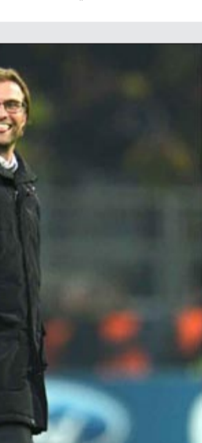
يوب هاينكس يتصارع مع يورغن كلوب على اللقب الأوربي

على تركيزنا. امامنا هدف واضح المعالم: الفوز (بالكأس صاحبة الأذنين الكبيرتين) (يطلق على كأس دوري الأبطال هينكلوبوت في ألمانيا أي الكوب الكبير ذو المقابض) ولن يخفينا أي احد عن هذا الهدف». وواصل هاينكس الذي سبق ان رفع الكأس القارية عام 1998 مع ريال مدريد الإسباني: «تركيز الفريق منصب تماما على الفوز، أنا لم ار