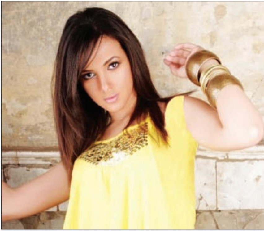
دنيا سمير غانم

وجهد المطربة البحرينية هند عتابا لشركة روتانا المنتجة للبروماتها، بسبب بطونها الشديد في الترويج لأعمالها وطالبتهم بتفعيل ميزانية لكلياتها. هند قالت إنها ستعيد تجربة الغناء باللهجة اللبنانية، بينما كشفت أن اسمها الحقيقي هو سهير، وأنها متزوجة حاليا من اللبناني جورج نمر مدير الإنتاج في