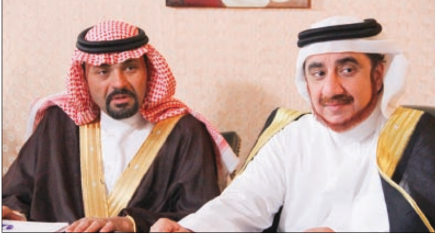
الجراح وعسيري في المسلسل

فيما أشار مؤلف العمل علاء حمزة إلى أن المسلسل في جزئه الثاني يواصل رصد ومعالجة قضايا من واقع المجتمع السعودي على تنوع ثقافته وفتاته العمرية، وأن المواهب الشابية التي تم اختيارها من خلال مشروع «طريق المواهب» ستحظى بفرص مثالية من خلال المسلسل، وهذا يعد ذاته إضافة قوية لتجديد شباب الدراما السعودية.