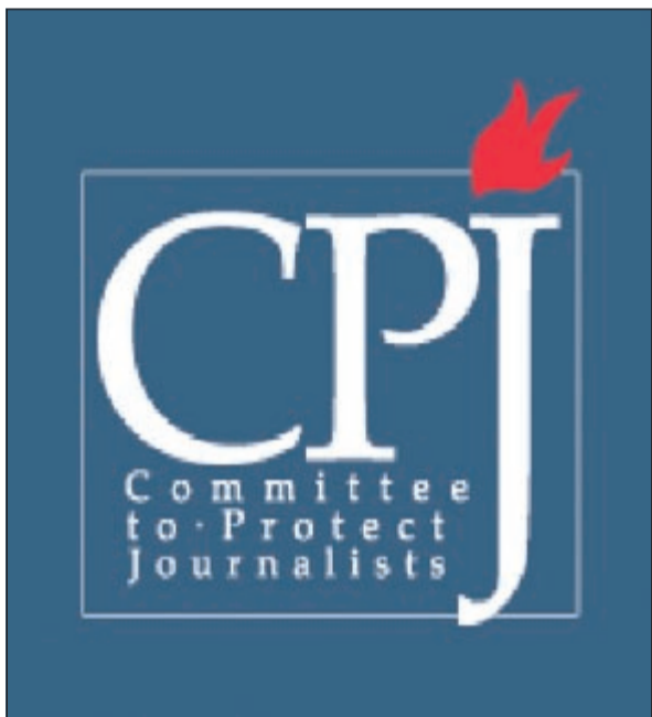
شعار لجنة حماية الصحفيين

5 بلدان تهجيرا للصحافيين هي الصومال حيث غادرها إلى المنفى 78 صحافياً وتليها إيران بـ 68 صحافياً تم تهجيرهم أو هربوا واختاروا العيش في المنفى بسبب تلقيهم تهديدات بالقتل أو التعرض للعنف، تليهما إثيوبيا بـ 49 صحافياً وبعدهم العراق بـ 40 صحافياً اضطروا لمغادرتها إما إجباراً أو طوعاً هرباً من التعرض للقتل أو القتل، وآخر تلك الدول التي تنصدر قائمة أكثر البلدان طرداً للصحافيين خلال السنوات الـ 5 الأخيرة إريتريا بـ 27 صحافياً.