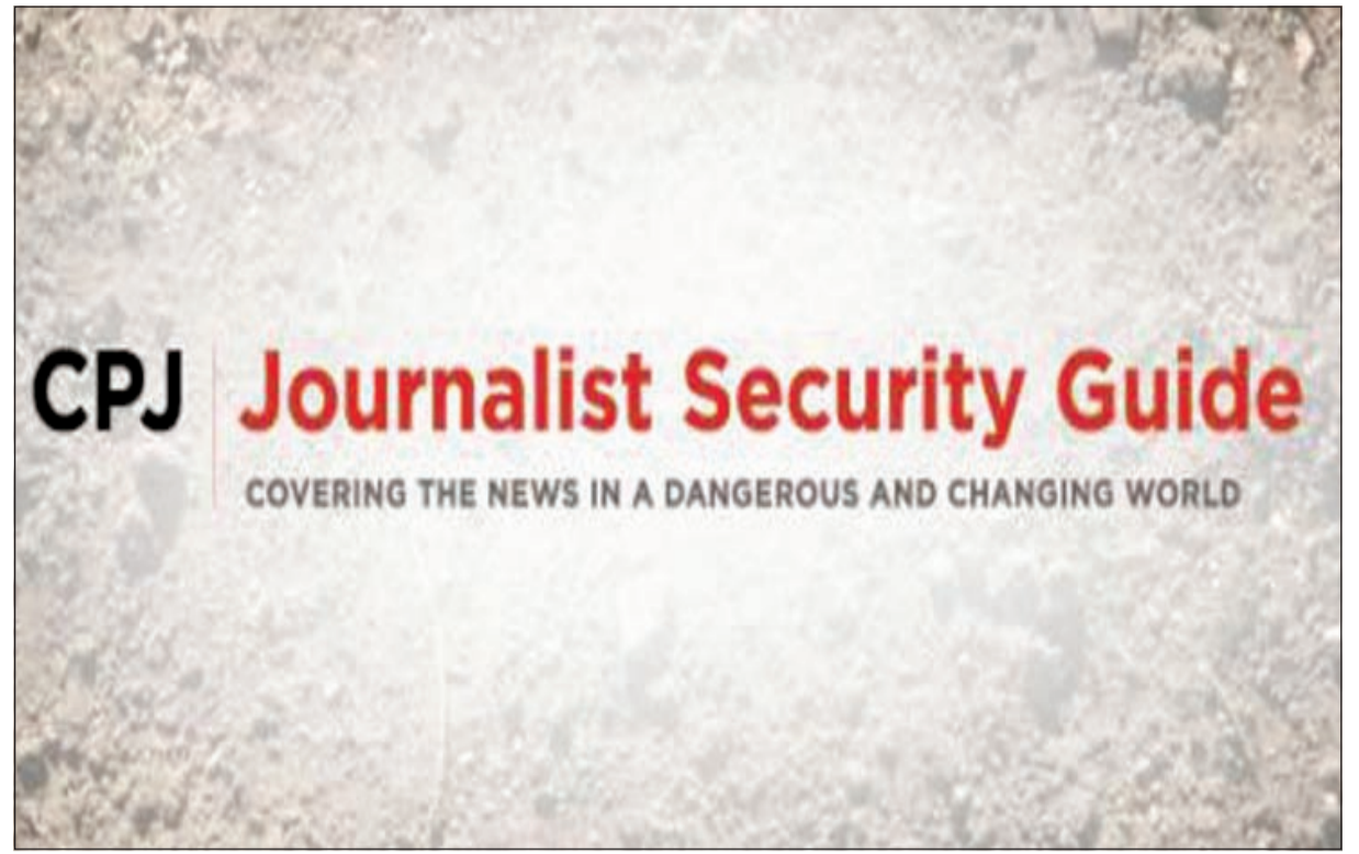
واجهة دليل أمان الصحفي