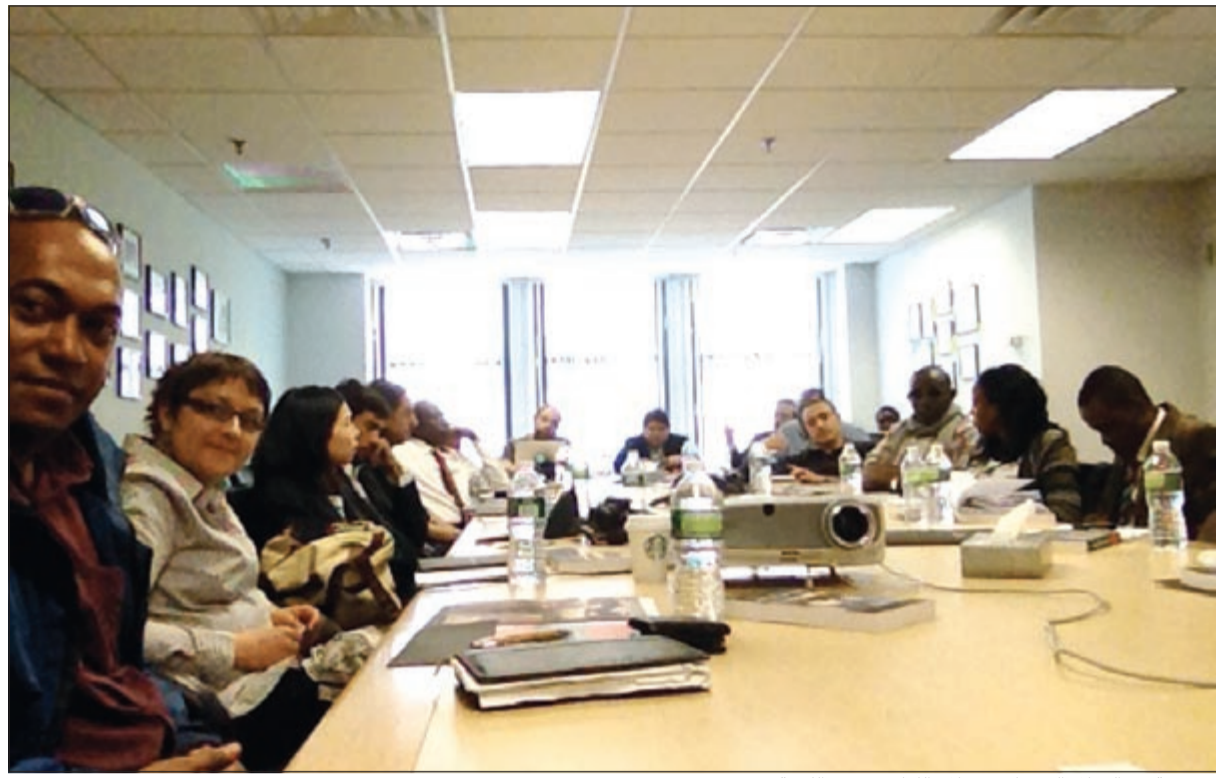
مجموعة من الزملاء الصحفيين خلال اللقاء في مقر اللجنة بنيويورك