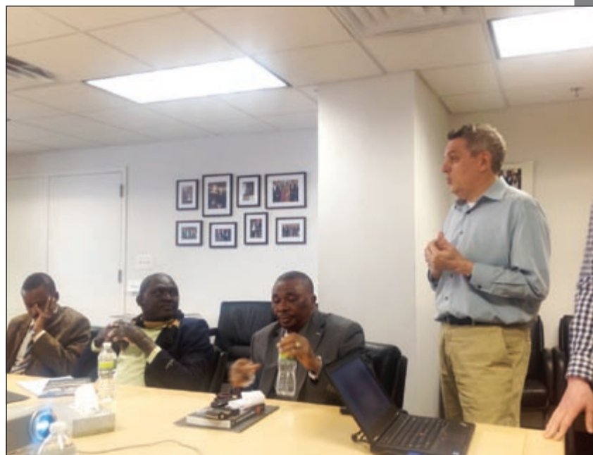
المساعد التنفيذي للجنة حماية الصحفيين متحدثاً للوفد الصحافي